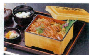
746-31-934 [A]D.X井重花梨春秋内朱 4,300円 18.2×15.3×8cm 50入 77629933