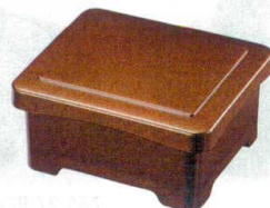
746-28-934 [A] (小) 象足井重梨地内朱塗 1,180円 14.2×12.5×7cm 60入 74628934