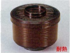
746-7-934 [TA]新へぎ目飯器溜内朱 1,300円 11.5×9.5cm・内寸10.2×6.8cm 100入 74607934