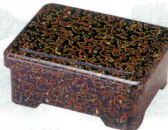
746-30-934 [A]長手うな重堆朱内朱塗 3,350円 17.8×13.7×7.8cm 50入 78307932