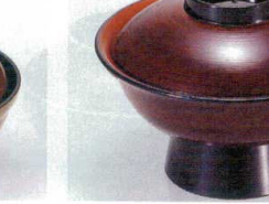
746-26-934 [A]5.5寸大名椀溜刷毛目内朱 2,600円 16.3×11.5cm 60入 78107932