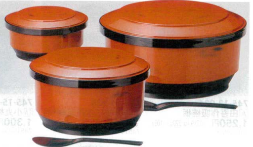
[A] いずみ飯器根来 746-17-934 1人用平なし 1,500円 15×7cm・内寸12.8×5.9cm 60入 78127932 746-18-934 2人用平付 2,700円 18×10cm・内寸15.5×8.4cm 40入 78128932 746-19-934 3人用平付 3,700円 22.3×12.5cm・内寸19.7×9.9cm 26入 78129932 746-20-934 5人用平付 4,900円 27×13.5cm・内寸23.8×10.6cm 20入 78130932 746-21-934 10人用平付 7,850円 32.2×17cm・内寸28.2×13.5cm 8入 78131932