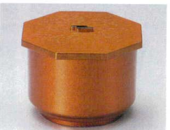
746-10-934 [A]江戸飯器金梨地内朱1段 1,400円 12.3×11.4×8.6cm・内寸10×7.1cm 80入 77610933