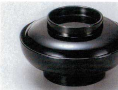
746-22-934 [A]5.5寸大平椀黒内朱天黒 1,200円 16.6×9.5cm 60入 74622934