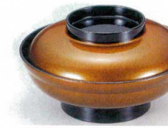
746-24-934 [A]新広輪井(小)金梨地つば黒 2,200円 17.6×9.8cm 50入 77613933