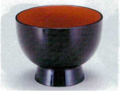
746-12-934 [A]4.5寸高台お好み椀黒内朱 1,200円 13.5×10.2cm(700cc) 120入 74612934