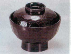
746-13-934 [A] (大) 亀甲井溜 1,600円 15.6×13.8cm 50入 78110932