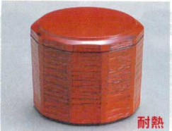
746-8-934 [TA]低型木彫一人用飯器根来 2,100円 10.5×8.5cm・内寸10.1×5.9cm 100入 77607933