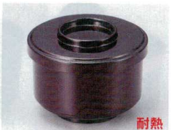
746-4-934 [TA] (小) 切立飯器溜内朱 1,250円 10.7×7.9cm・内寸9.4×5.9cm 100入 77604933