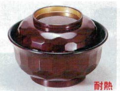
746-16-934 [TA]真亀甲井溜つば金 2,750円 15.8×10.4cm 50入 78117932