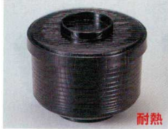
746-6-934 [TA]新へぎ目飯器黒内朱 1,150円 11.5×9.5cm・内寸10.2×6.8cm 100入 74606934