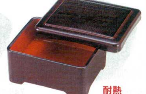
746-29-934 [TA]耐熱井重新木目溜内朱塗1段 1,850円 16.8×14.3×7.8cm 60入 78305932