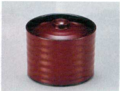
746-3-934 [A]昇月飯器銀朱 1,300円 9.5×7.7cm 100入 77603933