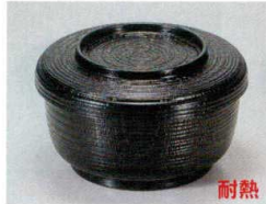
746-1-934 [TA] (小) 割子飯器黒 700円 12.3×7.6cm・内寸10.9×5.1cm 100入 77601933