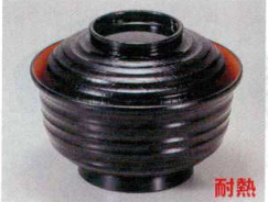
746-14-934 [TA]乱筋飯器黒内朱 1,500円 13.5×10cm・内寸11.8×5.9cm 100入 74614934