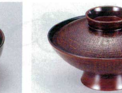
746-23-934 [TA]5.5寸煮物椀栴布目 2,400円 16.7×10.1cm 60入 77612933