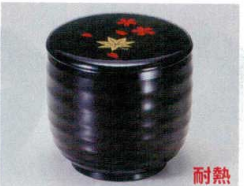
746-9-934 [TA]重さざ波飯器黒内朱蓋春秋 2,100円 10×9.5cm・内寸9.4×7.8cm 100入 77609933