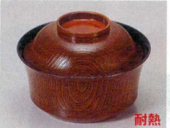
746-15-934 [TA]5寸富士型井椀栴 2,950円 14.7×10.2cm 50入 78116932