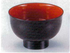
746-11-934 [A]羽反木目井黒内朱天黒 850円 13.3×8.7cm (870cc) 80入 74611934