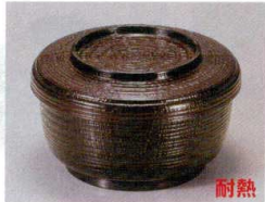
746-2-934 [TA]耐熱割子飯器溜 950円 13.4×8cm・内寸12.1×6cm 100入 78120932