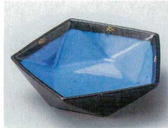
78-19-534 海流五角小鉢 720円 12.9×4cm 08029531