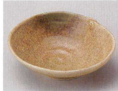
78-21-364 吹き織部とじめ小鉢 600円 13×12×4cm 07830363