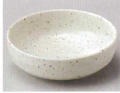
78-29-624 白唐津4.0小鉢 390円 13×4.2cm 07829624