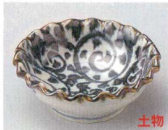
78-4-554 手描唐草菊型小鉢 1,100円 13×5cm 08114551