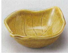
78-23-714 黄瀬戸木の葉小鉢 500円 13×11.6×4.3cm 07823714