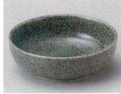
78-26-624 よもぎ唐津4.0小鉢 390円 13×4.2cm 07115621