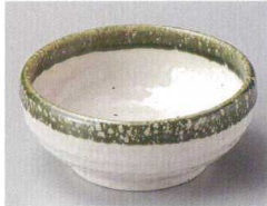
78-18-674 織部流入4.3ボール 720円 13×5.3cm 07724671