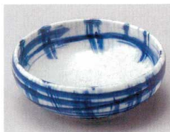
78-6-524 ササラ格子4.5取鉢 1,000円 13×4.7cm 06914521