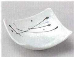
78-9-374 流星小鉢(美濃焼) 900円 13×13×4.5cm 07710373