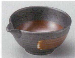
78-14-734 黒釉刷毛目片口小鉢 840円 13×11×6cm 08025731