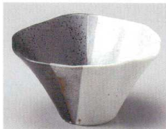
78-5-704 塗分朝顔型小鉢 1,020円 13×12.5×6.8cm 07805704