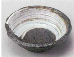
78-20-554 豪快・白凜12cm小鉢 630円 13×3.9cm 07820554