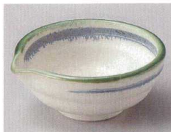
78-7-214 グリーン流し片口小鉢 920円 13×12.5×5.5cm 08116211