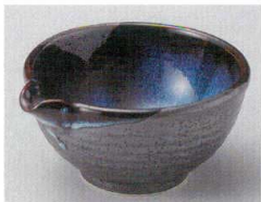
78-8-624 清流天目片口4.0小鉢 900円 13×11.5×6cm 07808624