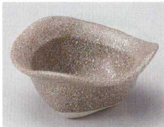
78-3-214 石肌三角小鉢 1,200円 13×6cm 09006212