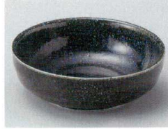
78-27-624 あい唐津4.0小鉢 390円 13×4.2cm 07827624