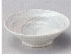
78-30-674 白雪4.0反小鉢 320円 13×4.1cm 09126012

盛鉢 14P~ 楕円鉢 組鉢 38P~ 刺身 向付 46P~ 中鉢 小鉢 64P~ 小付 珍珠 100P~ 細長皿 128P~ 突出皿 焼物皿 142P~ 仕切皿 のり皿 串焼皿 161P~ 盛皿 166P~ 角皿 (鉢鉢鉢) 174P~ 楕円皿 206P~ 丸皿 212P~ 和皿 前菜皿 丸手鉢 235P~ 組小皿 小皿 252P~ 有田焼大皿 萬古焼大皿 264P~ 組皿 (大) 270P~ 天皿 香水 取鉢 280P~ 松花堂 288P~ 蓋向 煮物碗 円菓子碗 298P~ むし碗 306P~