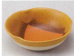
78-17-714 いろ紙三ツ押中鉢 780円 13×4.2cm 07628711