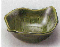
78-22-714 織部木の葉小鉢 500円 13×11.6×4.3cm 07822714