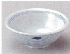
78-11-214 千筋点平取鉢 860円 13×5.3cm 08117211