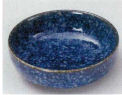
78-25-624 窯変ブルー4.0小鉢 390円 13×4.2cm 07825624