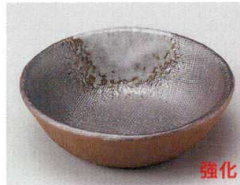
78-16-714 なごり雪4.0小鉢 800円 13×3.8cm 55267111