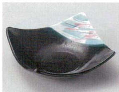
78-10-374 涼風小鉢(美濃焼) 900円 13×13×4.5cm 07709373