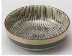
78-28-624 古代十草4.0小鉢 390円 13×4.2cm 07828624