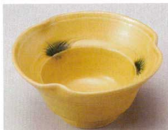
78-1-364 黄瀬戸三ツ押向付 3,600円 13×6.3cm 07801364