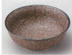
78-24-034 アップル(茶)4.0ボール 410円 13×4.7cm 07824034