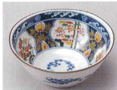
78-12-694 染錦紋様小鉢(有田焼) 850円 13×5.5cm(325cc) 5入 07812694