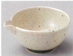
78-13-734 白釉鉄入片口小鉢 840円 13×11×6cm 08024731