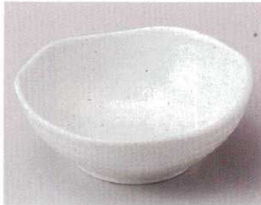
81-13-794 そば化粧小鉢(大) 1,050円 12.4×12.2×4.5cm 08113794