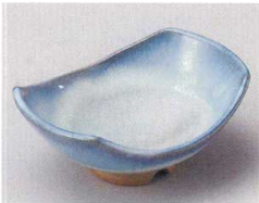
81-16-514 青乳両切小鉢 1,000円 12.2×10×5cm 08116513