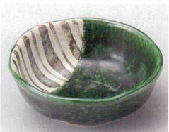
81-27-754 織部十草3.6小鉢 500円 12.3×4.5cm 08127754