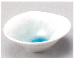
81-25-214 湖水たわみ小鉢 580円 12.1×11×4.4cm 08125214