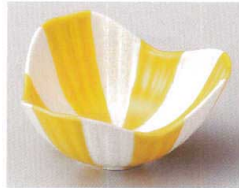
81-4-554 黄釉塗分割山椒小鉢 1,920円 12×6cm 08012553