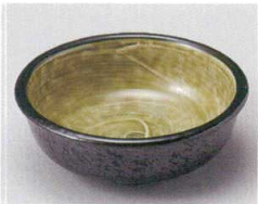
81-21-274 窯変丸4.0鉢 770円 12.3×4.3cm 08221271