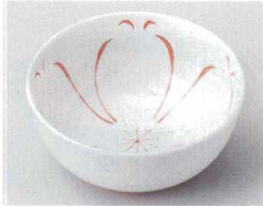
81-11-694 花ひらり小鉢(有田焼) 1,200円 12×5cm 5入 08015691