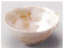
81-20-354 赤志野4.0小鉢 920円 12.3×6cm 08020351