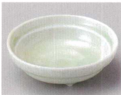
81-24-374 もえぎ三ツ足小鉢 660円 12.2×4cm 07525371