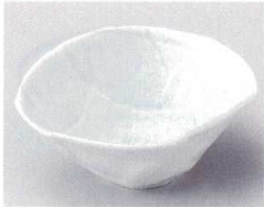
81-12-284 貼合青磁4.0小鉢 1,080円 12.2×10.7×5.2cm 80入 09411282