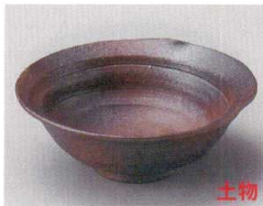
81-19-714 焼炎小鉢 920円 12.3×4.5cm 08212711