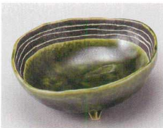
81-23-714 ライン織部三つ足楕円小鉢 720円 12.3×10.6×4.3cm 08123714