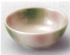
81-18-214 二色吹4.0鉢 940円 12×8.5cm 08308211