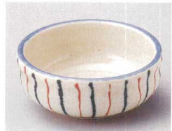
81-5-114 一珍十草4.0鉄鉢 1,750円 12.3×5cm 08008111