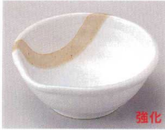
81-6-704 粉引塗分片口4.0鉢 1,680円 12.2×11.8×4.8cm 08304701