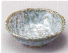
81-14-714 深山露4.0丸鉢 1,050円 12.3×4.2cm 54772711