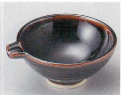
81-26-724 天目片口小鉢 560円 12.1×10.9×5.1cm 08908723