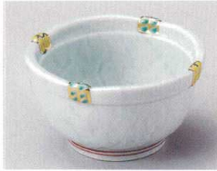
81-1-694 淵錦籠目小鉢(有田焼) 2,900円 12.2×12×6.7cm 5入 09402691