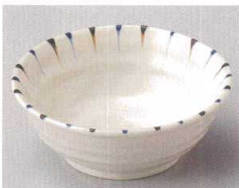
81-29-714 二色十草(青)片押し小鉢 480円 12×11.7×4.6cm 08313713