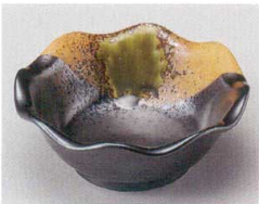
81-22-624 雅花型4.0小鉢 740円 12.3×4.6cm 08124621