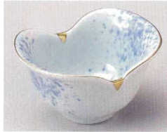
81-3-214 吹墨金彩双葉鉢 2,000円 12.1×8.7×6.4cm 08005211