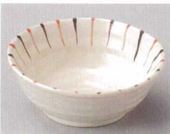
81-28-714 二色十草(赤)片押し小鉢 480円 12×11.7×4.6cm 08312713