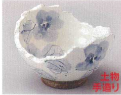
81-2-214 粉引ちぎり花小鉢 2,000円 12.2×11.5×7cm 09103212