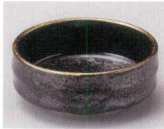
81-8-674 いぶし金4.5鉄鉢 1,320円 12×5cm 08107673