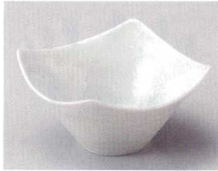
81-7-214 青白磁四方小鉢 1,450円 12.2×6.8cm 08012211