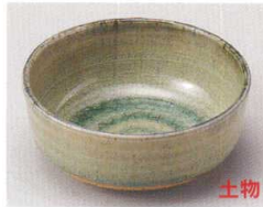
81-9-714 灰釉4.0小鉢 1,250円 12.2×5cm 08306711