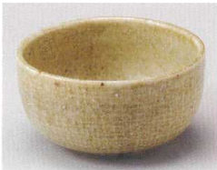
81-17-624 唐津風4.0深口ボール 960円 12.2×6.4cm 08309621