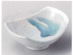
81-15-514 青雲両切小鉢 1,000円 12.2×10×5cm 08117513