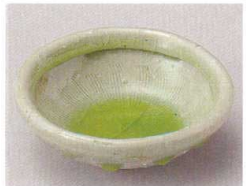
83-6-274 信楽風ビードロ小鉢 2,050円 11.7×3.8cm 08511273