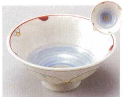
83-2-274 唐津見込福文字反小鉢 2,500円 11.8×5.3cm 08405271