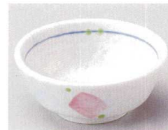
83-19-734 花ふぶき深口玉割 790円 11.8×4.7cm 08424731