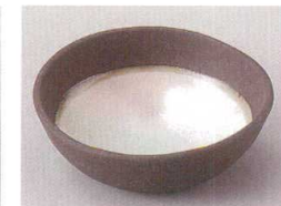
83-10-204 黒土フリーボール 1,280円 11.8×4.8cm 09409202