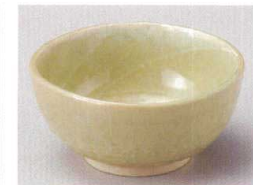
83-20-714 彩り(グリーン)4.0鉢 780円 11.7×11.7×5.3cm 08521711