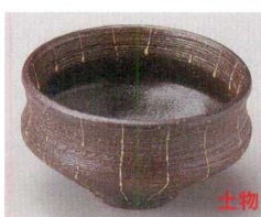
83-3-214 一珍細十草抹茶型鉢 2,450円 11.8×6.6cm 08503213