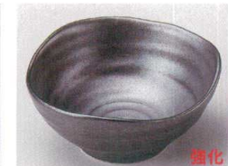
83-15-754 黒変形ボール 930円 11.7×11.2×5cm 08517751