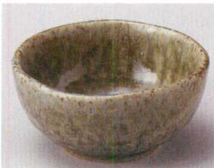
83-23-714 益子結晶3.5鉢 700円 11.8×5.7cm 09425712