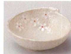
83-14-714 白押花ボール(小) 940円 11.8×4.7cm 08714711