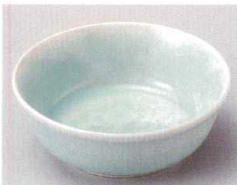
83-18-184 青白磁唐草3.8小鉢 800円 11.7×4.3cm 08217181