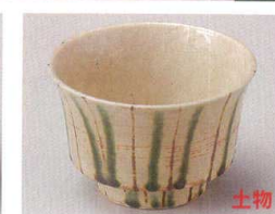
83-5-214 黄粉引二色十草丸反小鉢 2,100円 11.8×7.5cm 08408212