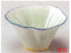
83-12-714 御深井朝顔型小鉢 1,030円 11.8×6.3cm 08816712