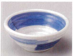
83-26-274 ゴス刷毛玉淵小鉢 660円 11.8×4.8cm 08625271