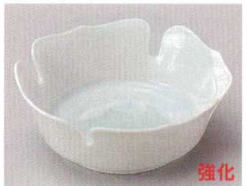
83-7-214 青白瓷輪花双魚小鉢 1,800円 11.8×4cm 08410211