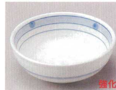
83-24-714 ダミライン小鉢 680円 11.9×4.3cm 80入 08824783