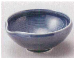
83-8-214 藍彩片口小鉢 1,700円 11.8×11.6×5.3cm 08308214