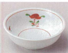
83-28-364 青地赤絵小花反3.5鉢 580円 11.7×4.2cm 08328364