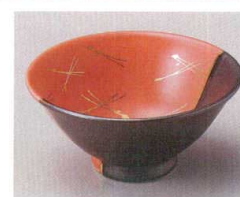
83-4-274 塗り分け金松葉反小鉢 2,400円 11.8×5.3cm 08404271