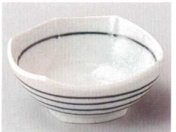
83-22-254 呉須ライン五角小鉢 760円 11.7×11.5×4.7cm 09019252