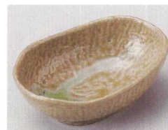
83-29-054 黄伊良保小判型小付 400円 11.7×8.2×4.2cm 11225051