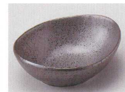
83-30-504 油滴天目三角小鉢 350円 11.8×9.8×5cm 08330504

盛鉢 14P~ 楕円鉢 組鉢 38P~ 刺身 向付 46P~ 中鉢 小鉢 64P~ 小付 珍珠 100P~ 細長皿 128P~ 突出皿 焼物皿 142P~ 仕切皿 のり皿 串焼皿 161P~ 盛皿 166P~ 角皿 (鉢縁類) 174P~ 楕円皿 206P~ 丸皿 212P~ 和皿 前菜皿 7ル~準皿 235P~ 組小皿 小皿 252P~ 有田焼大皿 青古焼大皿 264P~ 組皿 (大) 270P~ 天皿 香水 取鉢 280P~ 松花堂 288P~ 蓋向 煮物碗 円菓子碗 298P~ むし碗 306P~