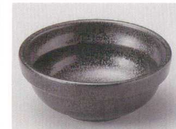
83-25-254 黒結晶スタック平鉢 680円 11.7×4.8cm 08903253