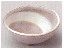
83-17-274 練り込み三つ足丸小鉢 950円 11.8×5cm 08425271