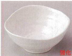
83-13-754 白変形ボール 950円 11.7×11.2×5cm 08617751