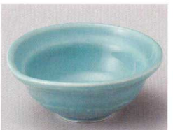
83-27-674 深海なぶり3.8鉢 620円 11.8×11.2×4.8cm 08628671