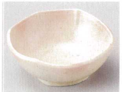
83-21-254 ピンク吹き五角香水 760円 11.7×11.5×4.7cm 09725252