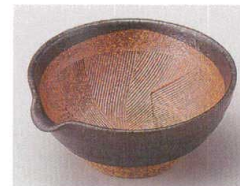
83-9-204 黒結晶4.0片口すり鉢 1,540円 11.8×11.2×5cm 09405202