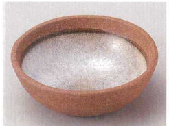
83-11-204 赤土フリーボール 1,280円 11.8×4.8cm 09408202