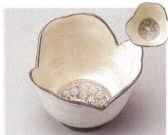
83-1-274 鈴木窯割山椒 4,500円 11.8×11.8×8.5cm 53505272