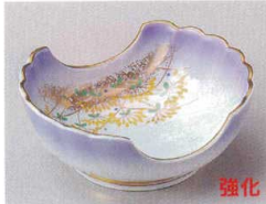
84-2-204 安曇野二方切小鉢 2,200円 11.5×10.2×4.5cm 09603202