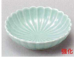
84-10-354 翡翠菊形丸小鉢 1,170円 11.5×3.3cm 08623353