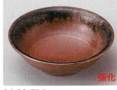
84-20-714 みのり3.6丸鉢 850円 11.4×3.8cm 08420714