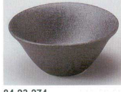
84-23-274 黒鉄サラダボウル 小 860円 11.6×5.1cm 08722271