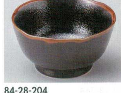
84-28-204 黒天目3.6小鉢 520円 11.5×6cm 09327202