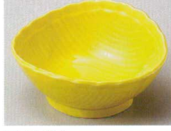
84-18-794 黄精円小鉢 900円 11.6×10.3×5.8cm 08618791