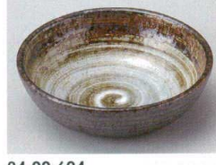
84-22-624 白刷毛3.8丸鉢 790円 11.4×3.4cm 08422624