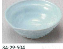
84-29-504 青足付片口小鉢 230円 11.5×11.2×4.3cm 08429504