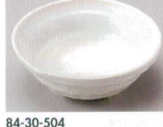
84-30-504 白足付片口小鉢 230円 11.5×11.2×4.3cm 08430504