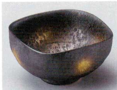
84-1-694 黒ゆず結晶金彩四方なぶり小鉢(有田焼) 2,650円 11.5×11.5×6cm 5入 08401691