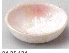
84-25-624 桜志野3.8丸鉢 770円 11.4×3.3cm 08425624