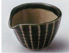
84-9-514 織部十草片口小鉢 1,200円 11.5×10×7.3cm 08609513