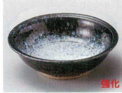
84-14-794 雲海3.6玉割 940円 11.5×3.7cm 55407781