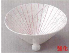
84-5-554 ピンク一珍三ツ足4寸小鉢 1,980円 11.5×5.4cm 80入 07216551