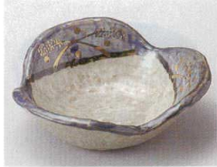
84-8-214 紫三峰浅小鉢 1,400円 11.5×3.8cm 08413211