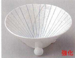
84-4-554 ブルー一珍三ツ足4寸小鉢 1,980円 11.5×5.4cm 80入 07217551