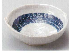
84-19-794 うず潮トジメ鉢 860円 11.7×4.5cm 08518791