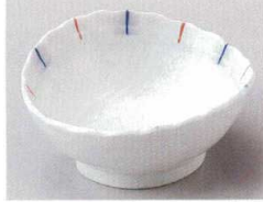
84-15-794 二色十草精円小鉢 930円 11.6×10.3×5.8cm 08415794