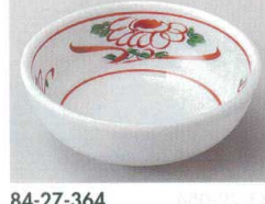
84-27-364 青地手描き赤絵玉淵3.5ボール 580円 11.5×4.3cm 08427364