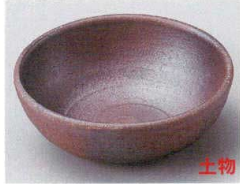
84-13-794 焼炎丸呑水 960円 11.5×4.5cm 28813781