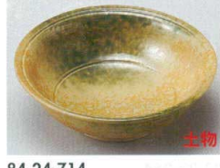
84-24-714 若草3.6玉子割 780円 11.5×3.7cm 29926781