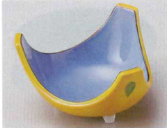
84-3-524 黄交趾三ツ山3.8小鉢 2,300円 11.5×6.5cm 09412521