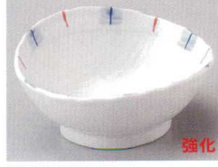
84-17-714 二色十草精円小鉢 900円 11.6×10.3×5.8cm 08418711