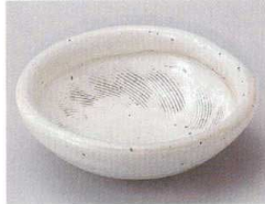
84-7-274 粉引刷毛櫛目片押小鉢 1,650円 11.5×11×3.5cm 08530273