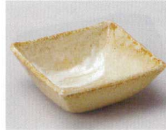
88-23-714 黄灰釉角小付 420円 10.5×10.5×4cm 08714712