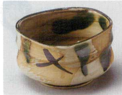
88-2-284 織部流し小鉢 2,200円 10.5×6cm 08704281