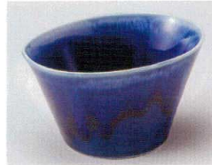
88-22-504 紺カジュアル小鉢 450円 10.7×8×6cm 08822504