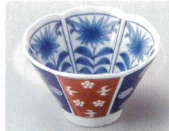
88-8-694 献上錦(コス梅千鳥)小鉢 880円 10.5×6.5cm 5入 09320692