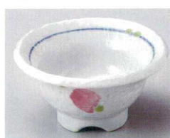
88-12-734 花ふぶき丸小鉢 780円 10.5×5.5cm 08813731