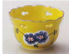
88-9-694 黄釉透し小鉢(有田焼) 850円 10.5×6.5cm 10×8入 08910691