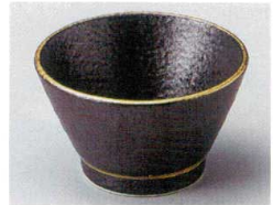
88-5-674 いぶし金江戸小鉢 1,250円 10.5×6cm 08904671