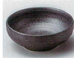
88-28-354 いぶし3.5ボール 310円 10.7×3.7cm 08929351