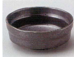
88-27-204 ゴールド結晶たいこ鉢 360円 10.6×4.2cm 09317203