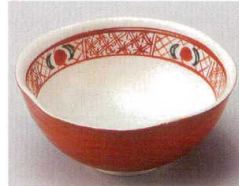
88-4-714 赤巻フリル小鉢 1,270円 10.6×4.5cm 08804714