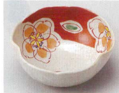
88-3-704 錦花紋小鉢 1,470円 10.8×10.8×4.5cm 08803704