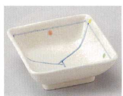
88-15-734 三彩水玉角小鉢 720円 10.8×10.7×3.8cm 08815734