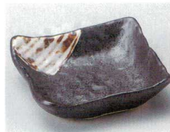
88-17-794 黒伊賀十草4.0角小鉢 700円 10.7×10.8×3.1cm 09214793