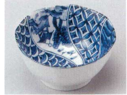
88-30-504 間取山水染付小鉢 230円 10.8×4.4cm 08830504