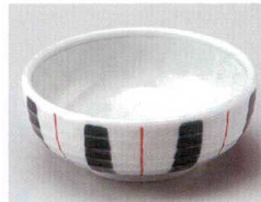
88-18-284 赤一珍呉須十草3.5浅鉢 670円 10.7×4.2cm 120入 08818284