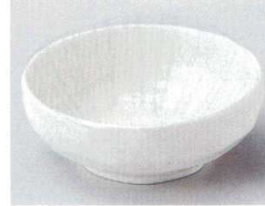
88-29-354 乳白3.5ボール 310円 10.7×3.7cm 09324353