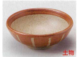
88-10-714 彫十草3.0丸鉢 800円 10.8×4cm 09126713