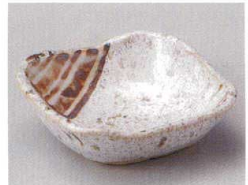
88-20-714 うのふストライプ3.0角鉢 550円 10.5×10.5×3.3cm 09226713