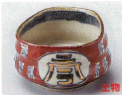
88-1-554 文字入赤濃小鉢 2,950円 10.5×9.8×6cm 08702551