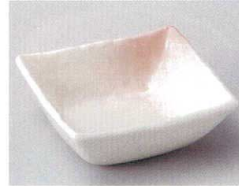
88-24-214 桜吹雪角小鉢 410円 10.5×10.5×4cm 08727211