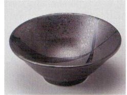
88-25-054 羽二重黒流し3.5小鉢 400円 10.8×4cm 08825054