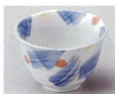
88-13-214 くし刷毛測波深小鉢 770円 10.5×7cm 08824212