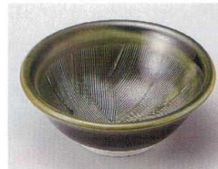
88-19-204 グリーン3.5スリ鉢 580円 10.7×4cm 09220203