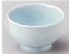
88-7-674 深山青磁3.5小鉢 890円 11×6.7cm 54864671