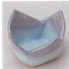
99-1-194 タタラ釉裏紅角小鉢(大) 1,500円 9.5×7cm 09706191 99-2-194 タタラ釉裏紅角小鉢(小) 1,050円 7.5×5.5cm 09705191