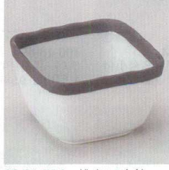
99-26-714 桃山3.5小鉢 720円 9×9×5.5cm 09834711 99-27-714 桃山3.0小鉢 630円 7.9×7.9×5.4cm 09833711