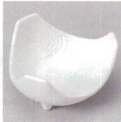
99-7-194 白磁流水型小付(大) 1,150円 8.5×6.1cm 09907194 99-8-194 白磁流水型小付(小) 810円 6.7×4.5cm 09908194