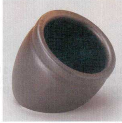
99-17-114 備前吹たこぼ鉢 中 880円 7.7×8cm 10608112 99-18-114 備前吹たこぼ鉢 小 550円 5.7×6cm 10609112