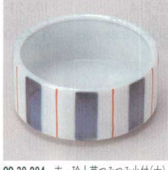
99-38-284 赤一珍十草つみつみ小付(大) 450円 8.5×4cm 100入 10531282 99-39-284 赤一珍十草つみつみ小付(小) 390円 7.7×3cm 120入 10532282