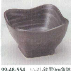
99-48-554 いぶし鉄黒9cm角鉢 400円 8.8×6cm 10351553 99-49-554 いぶし鉄黒7cm角鉢 300円 7.6×4.8cm 10352553