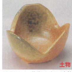
99-24-714 若草三ツ切3.6小鉢 土物 1,150円 10×6.5cm 10012781 99-25-714 若草三ツ切3.0小鉢 土物 750円 8×5cm 10011781