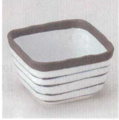
99-19-724 桃山ストライプ3.6角小鉢 760円 9×9×5.5cm 10315723 99-20-724 桃山ストライプ3.3角小鉢 670円 8×8×5.5cm 10316723