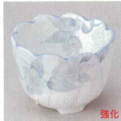
99-3-534 さがのねじり小鉢 強化 1,350円 9×6.5cm 10127532 99-4-534 さがのねじり小付 強化 1,250円 7.3×5.4cm 10128532