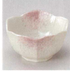
99-11-194 紫吹桔梗小鉢 大 970円 10.3×5.6cm 100入 09834193 99-12-194 紫吹桔梗小鉢 小 690円 8.3×4.8cm 120入 09835193