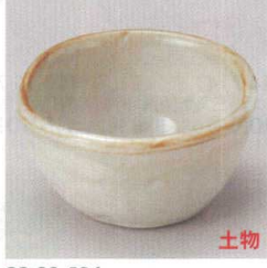
99-28-524 かすみ野厚割小鉢(中) (602040) (中国製) 600円 10×5cm 5入 10268521 99-29-524 かすみ野厚割小鉢(小) (602041) (中国製) 480円 7.8×4cm 10入 10267521