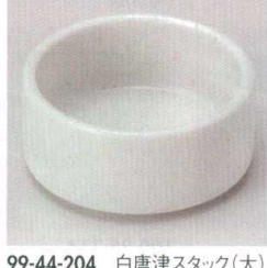
99-44-204 白唐津スタック(大) 430円 8.5×4cm 11307202 99-45-204 白唐津スタック(小) 400円 7.8×3cm 11308202