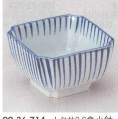
99-36-714 トクサ3.6角小鉢 450円 8.8×8.8×5.3cm 10329711 99-37-714 トクサ3.0角小鉢 320円 7.2×7.2×5.2cm 10328711