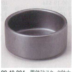
99-40-204 黒鉄砂スタック鉢大 430円 8.5×4cm 09940204 99-41-204 黒鉄砂スタック鉢小 400円 7.8×3.1cm 09941204