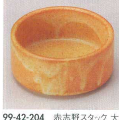
99-42-204 赤志野スタック 大 430円 8.5×4cm 10549202 99-43-204 赤志野スタック 小 400円 7.8×3cm 10550202