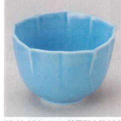
99-21-194 トルコ桔梗型小鉢(大) 760円 8.8×6cm 120入 10317193 99-22-194 トルコ桔梗型小鉢(中) 720円 7×5cm 11848191 99-23-194 トルコ桔梗型小鉢(小) 480円 6.3×5cm 11847191