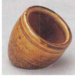
99-15-114 アメ斑点たこぼ鉢 中 880円 7.7×8cm 10614112 99-16-114 アメ斑点たこぼ鉢 小 550円 5.7×6cm 10615112