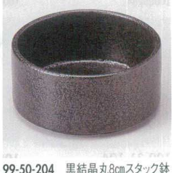
99-50-204 黒結晶丸8cmスタック鉢 400円 8.4×4.2cm 09950204 99-51-204 黒結晶丸7.5cmスタック鉢 360円 7.4×3.9cm 09951204