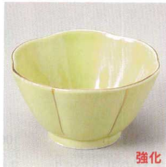
99-9-714 測金ヒワ梅型小鉢(大) 強化 1,030円 9.8×5.4cm 09909714 99-10-714 測金ヒワ梅型小鉢(小) 強化 890円 8.7×5.1cm 09910714