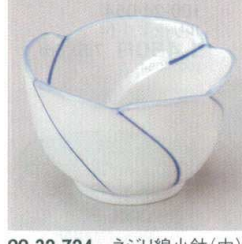
99-32-724 ネジリ線小鉢(中) 450円 9.8×6.3cm 10339721 99-33-724 ネジリ線小鉢(小) 320円 9×5.5cm 10338721