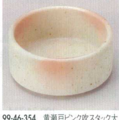
99-46-354 黄瀬戸ピンク吹スタック大 420円 8.6×4cm 09920351 99-47-354 黄瀬戸ピンク吹スタック小 370円 7.8×3cm 09919351