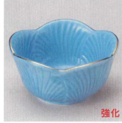
99-13-714 測金トルコ葉型小鉢(大) 強化 960円 9.8×5cm 09720711 99-14-714 測金トルコ葉型小鉢(小) 強化 880円 8.8×5.2cm 09719711