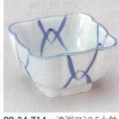
99-34-714 波瀾アミ3.5小鉢 450円 9×9×5.4cm 10323711 99-35-714 波瀾アミ3.0小鉢 320円 7.3×7.3×5.4cm 10322711