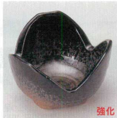
99-5-714 黒緑彩三ツ切3.6小鉢 強化 1,280円 9.7×6.6cm 100入 10019783 99-6-714 黒緑彩三ツ切3.0小鉢 強化 890円 7.8×5.2cm 120入 10020783