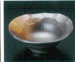
10024-457 美濃備前面取小鉢 440円 100人 (12×4cm)