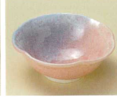
10019-527 ざくら花小鉢 660円 100人 (11.8×4.7cm)