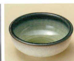
10027-107 均窯グリーン4.0小鉢 420円 80人 (11.8×4.7cm)