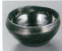
10013-297 くくり(黒)小鉢 1,250円 100人 (11.7×6.5cm)