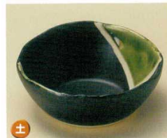
10011-577 モダン三角織部 ボール(小)(黒) 1,300円 50人 (11.7×4.8cm)