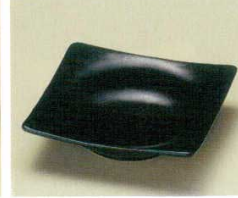
10018-407 黒マツ角鉢 700円 80人 (12×12×3cm)