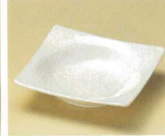
10017-407 白唐津角鉢 700円 80人 (12×12×3cm)