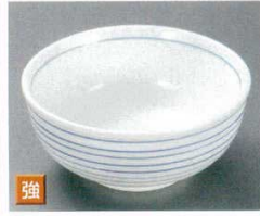
10009-577 強化駒筋12cmボール 1,350円 80人 (12×5.4cm)