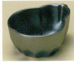
10008-177 虹色ヒサゴ型小鉢 1,350円 60人 (12×10×5.4cm)