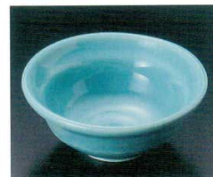
10021-027 深海なぶり3.8小鉢 650円 100人 (11.8×11.2×4.8cm)