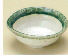
10020-027 織部流撚り3.8鉢 650円 100人 (12×11.5×5cm)