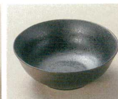
10030-407 黒いふしゆらぎ4.0鉢 390円 100人 (12×4.5cm)