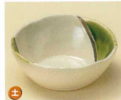
10012-577 モダン三角織部 ボール(小)(白) 1,300円 50人 (11.7×4.8cm)