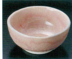
10015-527 ざくら3.5小鉢 760円 100人 (11.8×5.4cm)