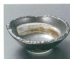
10026-277 黒刷毛目波型小鉢 420円 60人 (12×5cm)