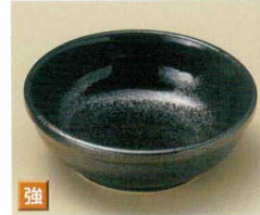
10016-477 黒釉織部掛玉割 750円 100人 (12×3.9cm)