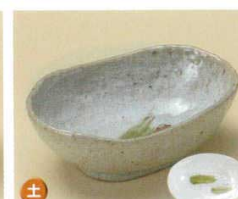
10028-307 粉引織部刷毛楕円小付 400円 100人 (12×8.3×4cm)