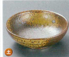
10014-307 灰吹刷毛目丸鉢 1,050円 100人 (12×4cm)