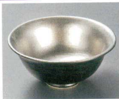
10001-457 天目内プラチナ四寸反小鉢(美濃焼) 2,350円 80人 (12×5.5cm)