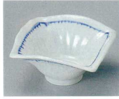
10010-257 呉須刷毛角反小鉢 1,300円 80人 (12×12×5.5cm)