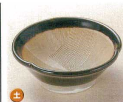
10022-307 黒織部三ツ押花形すり鉢小鉢 650円 100人 (12×4.5cm)