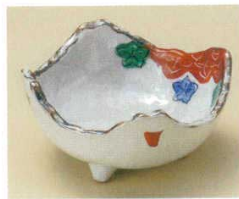
10006-187 雲錦四方上り小鉢 1,650円 50人 (11.7×11.7×6cm)