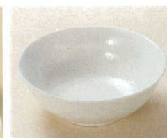
10029-407 白粉引ゆらぎ4.0鉢 390円 100人 (12×4.5cm)