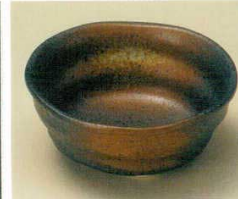
10025-577 黒備前角浜4.0鉢 400円 80人 (11.8×5cm)