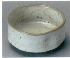
10007-307 粉引青磁丸鉢 1,300円 40人 (12×6cm)