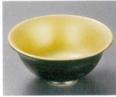
10003-457 天目内金彩四寸反小鉢(美濃焼) 1,880円 80人 (12×5.5cm)