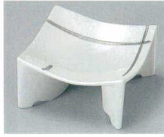
10005-137 一珍白磁プラチナ線高台四方小鉢 1,680円 48人 (11.7×11.7×5.9cm)