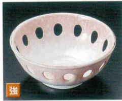
10002-557 ピンク吹スカシ小鉢 2,350円 60人 (11.8×4.8cm)