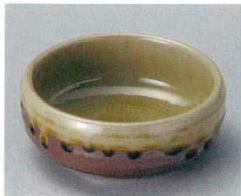
10113-257 貫入4.0ボール 1,000円 80入 (11.5×5cm)