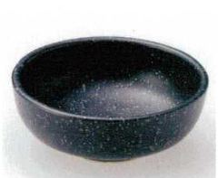
10129-137 銀黒丸小鉢 440円 80入 (11.6×4.6cm)