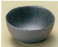
10112-307 鉄ペーパーハス ポウル 1,050円 100入 (11.6×11.6×6cm)