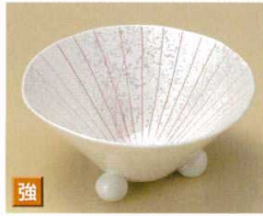
10106-177 ピンクー珍三ツ足4寸小鉢 1,980円 80入 (11.5×5.1cm)