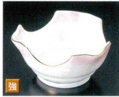
10107-257 ピンク吹割山椒小鉢 1,900円 80入 (11.5×6cm)