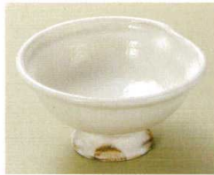
10102-667 粉引高台小鉢 (信楽焼) 3,300円 90入 (11.5×11.5×6cm)