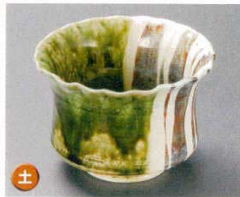
10104-147 織部十草輪花小鉢 2,800円 40入 (11.5×7.8cm)