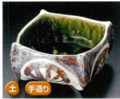
10101-517 織部つまみ四方鉢 3,800円 40入 (11.5×6.3cm)