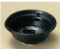
10125-407 基星なぶり4.0小鉢 600円 80入 (11.7×11×4.5cm)