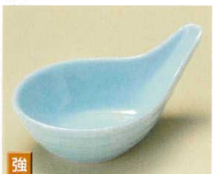
10123-577 手付小鉢 青磁 700円 200入 (11.7×7.2×5cm)