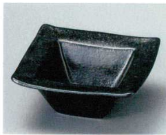
10110-307 銀黒角小鉢 1,200円 80入 (11.5×11.5×5cm)