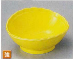
10118-557 黄楕円小鉢 860円 100入 (11.6×10.3×5.8cm)