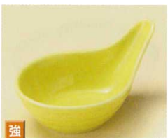
10124-577 手付小鉢 黄 700円 200入 (11.7×7.2×5cm)