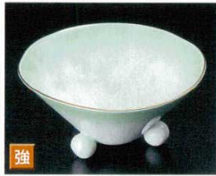
10108-147 刷金ヒワ吹三ツ足小鉢 1,850円 50入 (11.7×5.3cm)