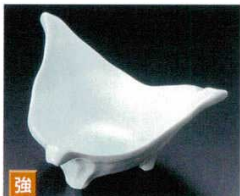
10114-297 青白磁ちぎり三角小鉢 1,000円 80入 (11.7×7cm)