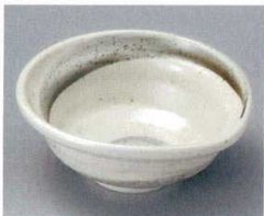
10121-317 マット渦なぶり小鉢 730円 120入 (11.5×4.5cm)