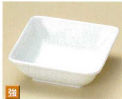
10111-577 白磁正角鉢 1,100円 80入 (11.6×11.6×4cm)