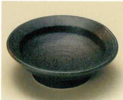
10120-467 備前風高台小皿 750円 100入 (11.5×3.6cm)