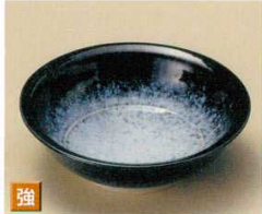
10116-557 雲海3.6丸井 900円 120入 (11.5×3.7cm)