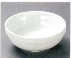
10128-237 ざざ波白スタック小鉢 440円 100入 (11.6×4.6cm)