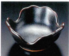
10122-557 鉄砂釉三つ山3.8鉢 720円 80入 (11.5×5.2cm)