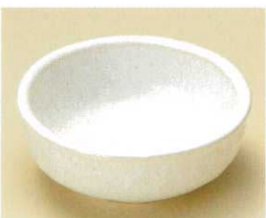
10130-577 粉引玉淵3.6深鉢 320円 20入 (11.7×4.8cm)