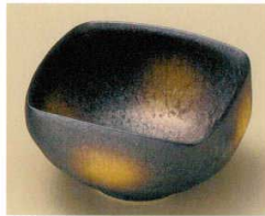
10103-737 黒ゆず結晶金彩四方なぶり小鉢 (有田焼) 2,900円 5×16入 (11.5×11.5×6cm)