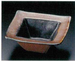
10109-237 回茶回小鉢 1,200円 90入 (11.5×4.7cm)