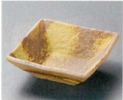
10119-187 美膳正角小鉢 840円 60入 (11.5×11.5×4cm)