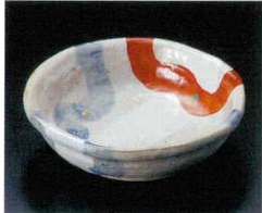
10117-557 赤絵志野陽炎3.5浅鉢 900円 100入 (11.5×3.3cm)