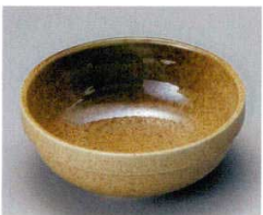
10127-457 伊賀織部スタック小鉢 540円 100入 (11.6×4.6cm)