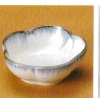
12929-437 ウノフ梅型小付 370円 150人 (8.3×3.1cm)