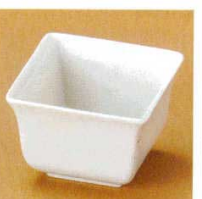
12933-197 白粉引角深小付 320円 200人 (7×7×5cm)