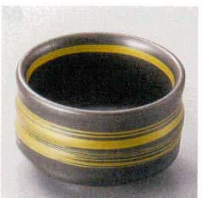
12915-457 抹茶型雲母金刷毛小付 740円 200人 (7.3×4.7cm)