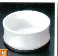
12923-577 強化白磁スタッキング小付 550円 120人 (7.8×3.5cm)