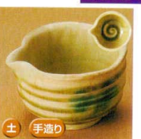
12906-307 黄瀬戸片口珍珠 (手造り) 1,200円 80人 (7.8×7.2×4.5cm)