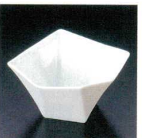
12916-577 青白磁折紙小付 720円 200人 (7.8×7.8×4.5cm)