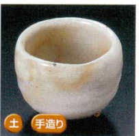
12910-307 粉引刷毛目手造り三ツ足珍珠 900円 100人 (7.3×5.7cm)