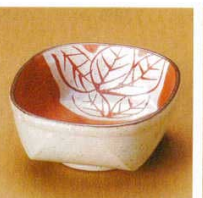
12917-237 赤絵木の葉小付 700円 200人 (7.9×3.8cm)