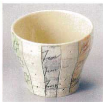
12902-517 色彩十草ミニカップ 1,600円 60人 (7.8×8.5cm・200cc)