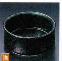
12922-577 強化イラボスタッキング小付 550円 120人 (7.8×3.5cm)