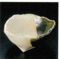
12921-317 桃山三ツ足小付 740円 120人 (7.5×4cm)