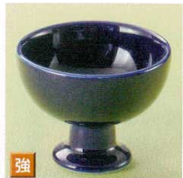
12913-577 墨はじき萩高台小付 800円 144人 (7.6×6cm)