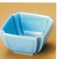
12918-437 トルコ測取小付 600円 150人 (7.9×4.6cm)