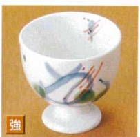
12904-557 色彩花鳥風月高台小付 1,500円 100人 (7.3×7cm)