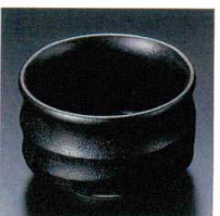
12931-457 黒伊賀抹茶小付 330円 200人 (7.3×4.8cm)