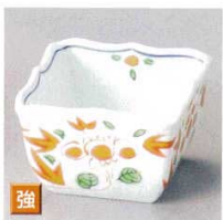
12903-437 赤絵小鉢 1,540円 120人 (7.9×7.9×5.2cm)