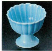
12907-437 トルコ菊型高台小付 900円 80人 (7.5×6.4cm)