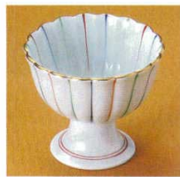
12901-437 色十草高台珍珠 1,780円 100人 (7.5×6.4cm)