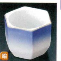
12912-317 コバルト吹刺金ボンボリ小付 (大) 900円 130人 (7.5×6.6×5.5cm)