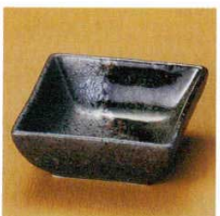
12925-437 黒伊賀抹茶小付 380円 150人 (7.7×3.2cm)