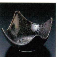
12927-457 伊賀四方小付 380円 120人 (6.4×4cm)