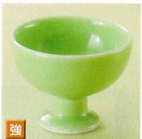
12914-577 緑高台小付 800円 144人 (7.6×6cm)