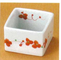
12905-737 帯花紋角小付 (赤) (有田焼) 1,300円 5×24人 (7×7×4.5cm)