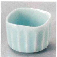
12909-147 青白磁そぎ四角鉢 900円 80人 (7.2×7.2×5.5cm)