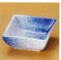
12926-437 吹ス四角小付 380円 150人 (7.7×3.2cm)