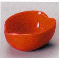
12920-257 プチざくら赤小付 800円 300人 (7×6×3.2cm)