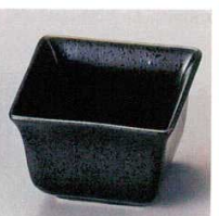
12932-197 黒結晶角深小付 320円 200人 (7×7×5cm)