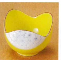
12911-737 黄ざくら小付 (有田焼) 900円 10×16人 (7×7×5.5cm)