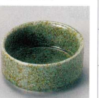
12930-197 つみつき蓋子小付 330円 200人 (6.8×3cm)