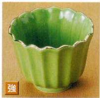
12908-557 オリベ菊型小鉢 920円 100人 (7.8×5.8cm)