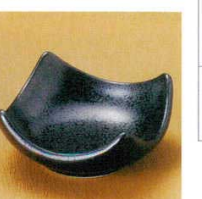
12936-197 黒袖角小付 290円 200人 (8×8×3.4cm)