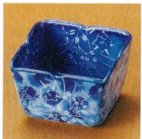
12919-737 墨はじき萩角小付 (有田焼) 600円 10×16人 (7×7×5cm)