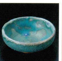
12928-267 トルコブルー丸小付 380円 180人 (8.1×2.8cm)