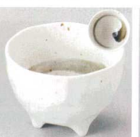
12934-207 白マット水晶三ツ足珍珠 290円 120人 (7.8×5.6cm)