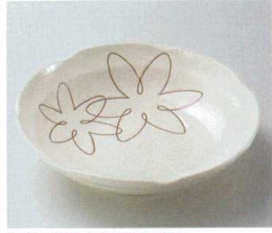
22821-317 ゆうか白6.8深皿 500円 40人 (20.5×5cm)