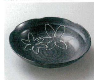
22822-317 ゆうか黒6.8深皿 500円 40人 (20.5×5cm)