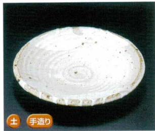
22801-307 夢唐津白波7.0厚皿 2,800円 30人 (21×3cm)