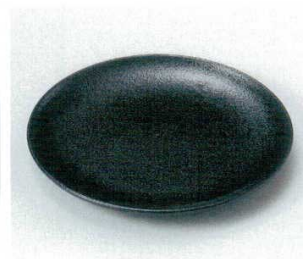
22826-027 美濃粉引黒21cm皿 450円 40人 (21×2.4cm) 22827-027 美濃粉引黒19cm皿 430円 60人 (19×2.4cm) 22828-027 美濃粉引黒16.5cm皿 360円 80人 (16.5×2.2cm)