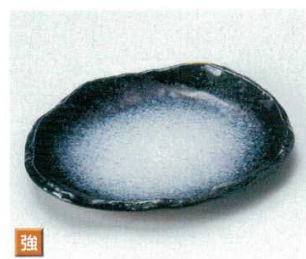
22805-557 雲海7.0変形皿 1,820円 40人 (21×18×2.5cm)