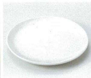
22823-027 美濃粉引白21cm皿 450円 40人 (21×2.4cm) 22824-027 美濃粉引白19cm皿 430円 60人 (19×2.4cm) 22825-027 美濃粉引白16.5cm皿 360円 80人 (16.5×2.2cm)