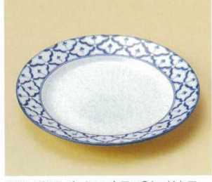
22814-277 チェンマイ モア21cmリム皿 1,050円 40人 (21×2.4cm) 22815-277 チェンマイ モア17cmリム皿 800円 80人 (17×2cm)