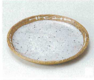
22812-547 うのふ茶唐津7.0丸皿 1,550円 30人 (20.7×1.8cm)