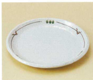
22806-547 織部結び7.0丸皿 1,800円 30人 (20.6×2.4cm)