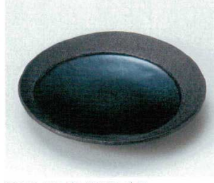
22813-457 青い月20cm丸皿 1,260円 40人 (20.5×2.8cm)