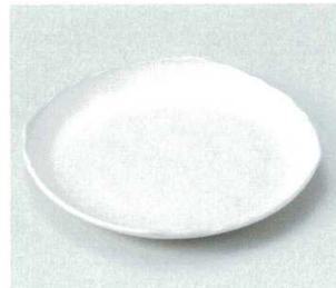
22829-277 粉引マット7.0皿 420円 50人 (20.9×20.9cm)