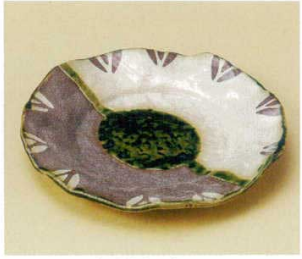
22804-577 志野織部7寸皿 2,050円 41人 (20.7×2.8cm)