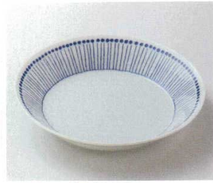
22819-197 蒼十草6.3深皿 600円 50人 (20.7×3.8cm)