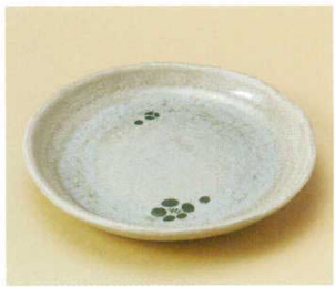
22808-187 梅ビードロ丸6.5皿 1,650円 30人 (20.5×3cm) 22809-187 梅ビードロ丸5.5皿 1,000円 40人 (16.7×2.4cm) 22810-187 梅ビードロ丸4.5皿 800円 60人 (13.8×2.3cm)