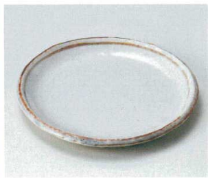
22807-557 志野ライン7.0丸皿 1,700円 40人 (20.6×2.4cm)