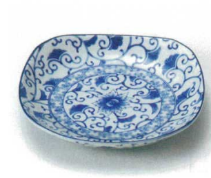
22816-197 藍彩四角7.5皿 950円 40人 (21×21×4cm) 22817-197 藍彩四角5.0皿 600円 100人 (15.2×15.2×3.2cm)