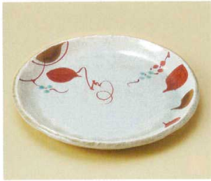
22802-547 赤絵木の葉7.0丸皿 2,350円 30人 (20.6×2.4cm)