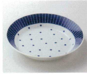
22820-197 蒼天6.3深皿 600円 50人 (20.7×3.8cm)