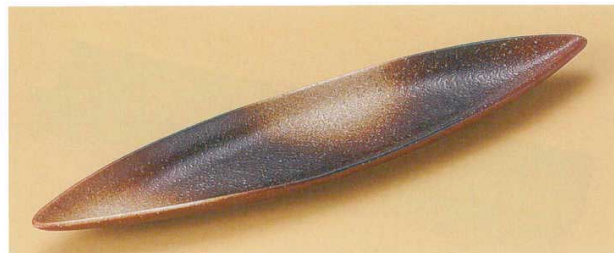
26206-137 古窯リーフプレート(大) 1,700円 40入 (38.6×8.6×2.7cm)