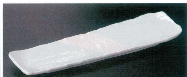
26215-137 薄氷長皿 1,450円 30入 (35.2×9.8×2.2cm)