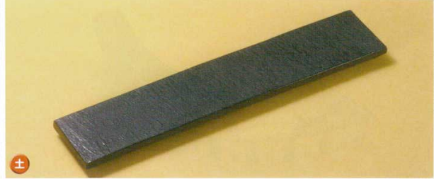
26203-467 黒陶石目四つ足細長皿 2,100円 50入 (34×7×2.2cm)