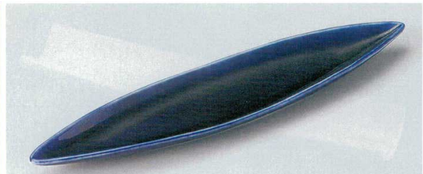
26209-137 瑠璃釉リーフプレート(大) 1,700円 40入 (38.6×8.6×2.7cm)