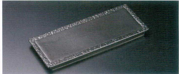
26205-467 黒マット淵形まな板皿 2,000円 30入 (32×12.8×1.7cm)