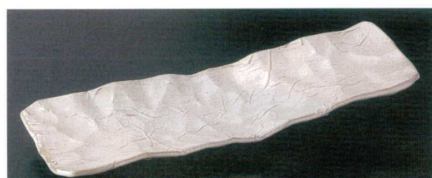
26214-317 手折粉引サンマ皿 1,550円 40入 (32.5×10.3×3.5cm)