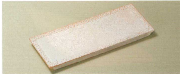
26204-467 赤志野まな板皿 2,000円 30入 (32×12.8×1.7cm)