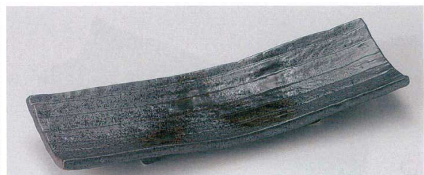
26213-317 南蛮ライン突出皿 1,620円 20入 (32×10.3×4.5cm)