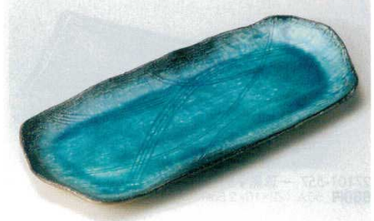
27203-467 スカイ黒淵変形ほっけ皿 1,950円 30入 (35.9×16.7×2cm)