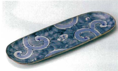
27204-517 古染濃唐草さんま皿 1,600円 40入 (33.5×11.5×1.5cm)