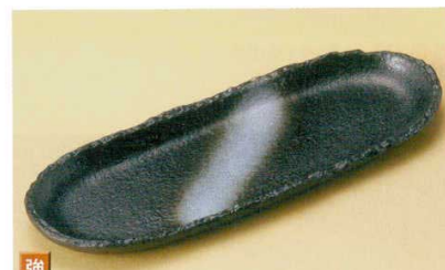
27210-557 白吹黒水晶10.0楕円長皿 1,500円 20入 (30.3×11×2.4cm)