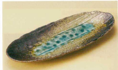
27212-177 和三彩手作りサンマ皿 920円 40入 (33×13.5×3.8cm)