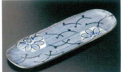
27209-517 ごす濃花丸紋さんま皿 1,600円 40入 (33.5×11.5×1.5cm)