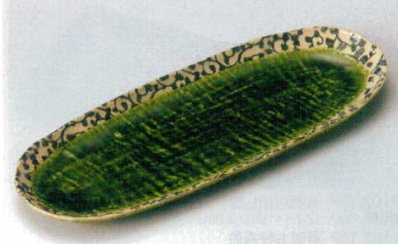
27202-517 唐草織部さんま皿 2,000円 30入 (31.5×12×1.6cm)