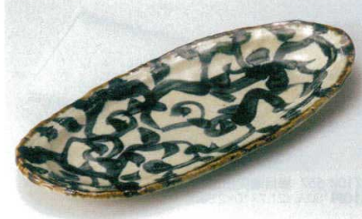
27201-297 新たご唐草夕月長皿 2,250円 60入 (32×14.8×2.6cm)