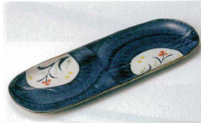
27208-517 ごす濃色絵花さんま皿 1,600円 40入 (33.5×11.5×1.5cm)