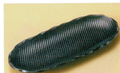
27213-107 黒唐津彫刻焼物皿 750円 50入 (31×13.2×2.7cm)