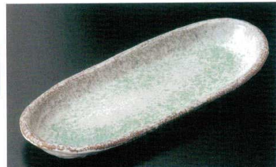
27207-647 青釉11号細小判皿(萬古焼) 1,600円 24入 (35×14×3cm)