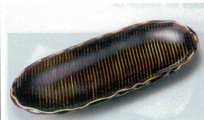
27215-107 アメ軸彫刻焼物皿 750円 50入 (31×13.2×2.7cm)