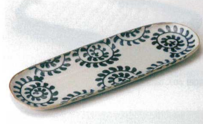
27205-517 染付たご唐草さんま皿 1,600円 40入 (33.5×11.5×1.5cm)