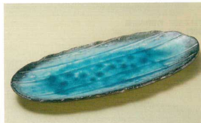
27211-027 藍染スカイ楕円長皿 1,100円 30入 (33×13.5×2.5cm)