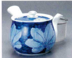
47518-737 濃葉彩 (U) 付特大急須 (有田焼) 3,600円 1×24人 (12×10.5cm・600cc)