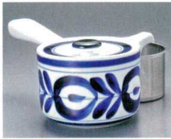
47510-737 マジョリカSS急須 (有田焼) 3,600円 1×30人 (10×8.5cm・420cc)