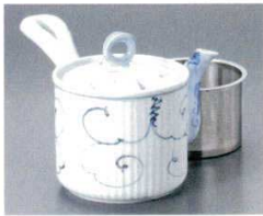
47509-737 唐草ぶどうSS軽量急須 (有田焼) 4,200円 1×30人 (9×10.5cm・350cc)