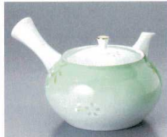
47529-737 花あかり中急須 (有田焼) 3,900円 2×15人 (11.5×8.5cm・350cc)