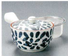
47524-737 夕コ唐草U付雀口中急須 (有田焼) 3,500円 1人 (250cc)