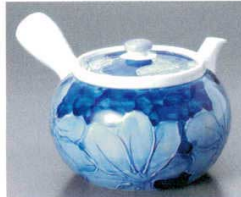
47530-737 濃葉彩中急須 (有田焼) 3,200円 2×15人 (11.5×8.5cm・450cc)