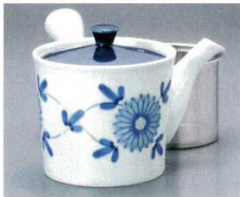
47504-737 藍花SS中急須 (有田焼) 4,300円 1×30人 (10.5×10.5cm・425cc)