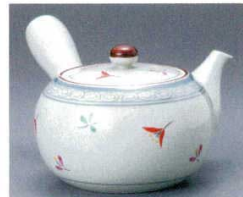
47527-737 花小紋M中急須 (有田焼) 3,900円 2×15人 (11.5×8.5cm・350cc)