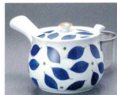
47521-737 木の葉 U付特大急須 (有田焼) 4,200円 1×24人 (12×10.5cm・600cc)