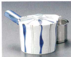
47502-737 乱れ十草SS急須 (有田焼) 4,900円 1人 (10.5×10.5×9.5cm・375cc)