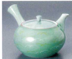
47528-737 さがの中急須 (有田焼) 3,800円 1×30人 (11×8cm・400cc)