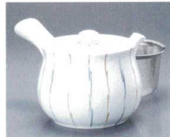
47517-737 麦わら十草U付特大急須 (有田焼) 3,600円 1×24人 (12×10.5cm・600cc)