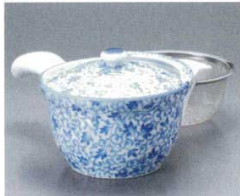
47514-737 花唐草 U付マービー急須 (有田焼) 3,700円 1×30人 (11×8.5cm・250cc)