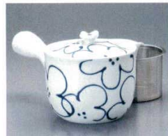
47511-737 花紋SS雀口急須 (有田焼) 3,600円 1×30人 (9.5×9cm・325cc)