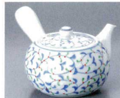
47526-737 都唐草M中急須 (有田焼) 4,200円 2×15人 (11.5×8.5cm・350cc)