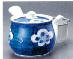
47522-737 梅香 U付特大急須 (有田焼) 3,600円 1×24人 (12×10.5cm・600cc)