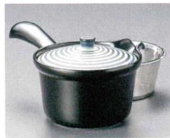
47507-737 藍駒SS急須 (有田焼) 4,300円 1人 (11×11×8.5cm・275cc)