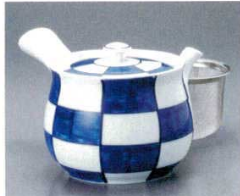
47519-737 濃市松 U付特大急須 (有田焼) 3,600円 1×24人 (12×10.5cm・600cc)