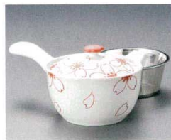
47506-737 錦桜SS平急須 (有田焼) 4,600円 1人 (11.5×11.5×8.5cm・325cc)