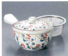
47523-737 錦草花U付雀口中急須 (有田焼) 3,500円 1×30人 (10.5×8cm・200cc)