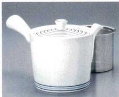
47503-737 白磁渦SS中急須 (有田焼) 4,300円 1×30人 (10.5×10.5cm・425cc)