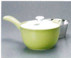
47505-737 リーフSS平急須 (有田焼) 4,300円 1×30人 (11.5×8.5cm・325cc)