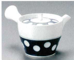
47525-737 水玉中急須 (有田焼) 4,600円 1人 (10×9cm・270cc)