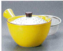
47513-737 黄さくら U付平急須 (有田焼) 4,200円 1×30人 (11.5×9cm・300cc)