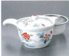
47515-737 花鳥 U付マービー急須 (有田焼) 3,800円 1×30人 (11×8.5cm・250cc)