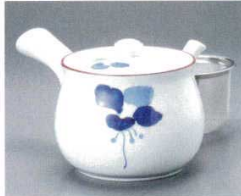
47520-737 まんりょう U付特大急須 (有田焼) 3,600円 1×24人 (12×10.5cm・600cc)