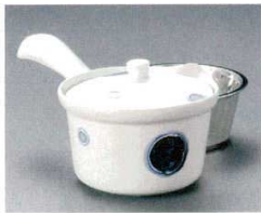
47508-737 丸紋SS平急須 (有田焼) 4,300円 1人 (11×11×8.5cm・275cc)