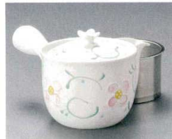
47512-737 一珍唐草SS雀口急須 (有田焼) 3,600円 1人 (330cc)