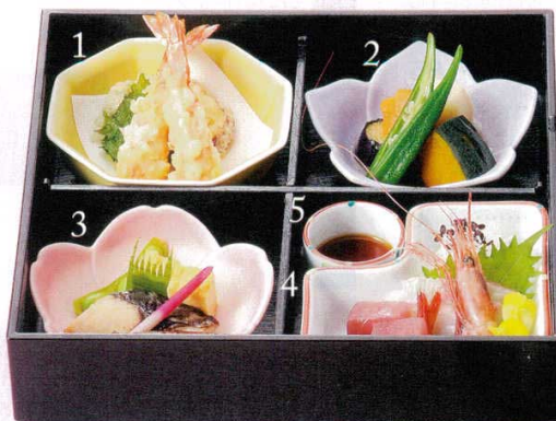
1,2,3,4,5 松花堂 146p~ Shoukado bento dish