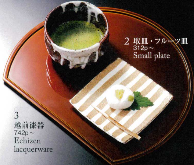
3 74336-807 4,150円 [A]尺3寸富士半月盆 漆調春慶塗B面黒漆