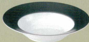
60018-237 26cm/パスタ (BR) 4,700円 30入 (26×5.4cm・内径16.8cm)