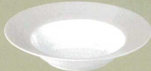
60017-237 26cm/パスタ (SV) 4,700円 30入 (26×5.4cm・内径16.8cm)