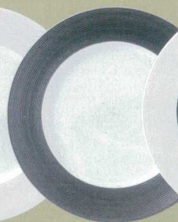
60024-237 INF 27.5cm プレート (BR) 4,800円 30入 (27.5×2.5cm・内径18.2cm)