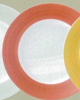
60021-237 INF 27.5cm プレート (RD) 4,800円 30入 (27.5×2.5cm・内径18.2cm)