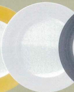
60023-237 INF 27.5cm プレート (SV) 4,800円 30入 (27.5×2.5cm・内径18.2cm)