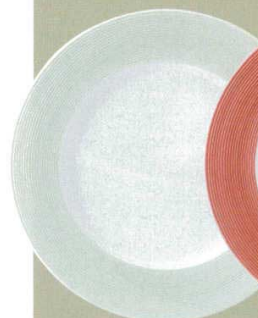
60020-237 INF 27.5cm プレート (GR) 4,800円 30入 (27.5×2.5cm・内径18.2cm)