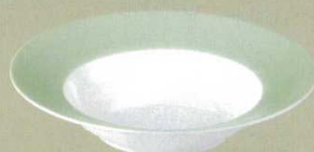
60014-237 26cm/パスタ (GR) 4,700円 30入 (26×5.4cm・内径16.8cm)