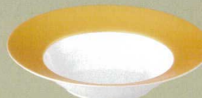
60016-237 26cm/パスタ (GL) 4,700円 30入 (26×5.4cm・内径16.8cm)