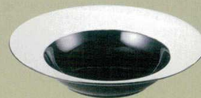
60019-237 26cm/パスタ (HP) 5,200円 30入 (26×5.4cm・内径16.8cm)