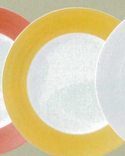
60022-237 INF 27.5cm プレート (GL) 4,800円 30入 (27.5×2.5cm・内径18.2cm)