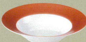
60015-237 26cm/パスタ (RD) 4,700円 30入 (26×5.4cm・内径16.8cm)