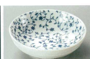
08024-317 花唐草4.5ボール 420円 60入 (15.1×4.8cm)