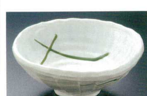
08021-297 織部タスキなで角鉢大 680円 30入 (15×15×5.7cm)