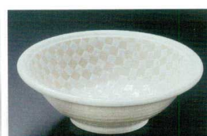
08019-057 雷地白4.8寸深鉢 710円 80入 (15×5.7cm)