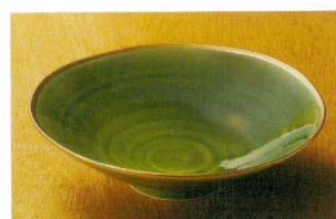
08013-737 四袖金緑平小鉢(有田焼) 1,950円 5×16入 (15×4.5cm)