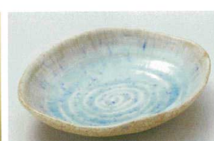
08018-457 清流岩清水三ッ足変形向付 1,000円 60入 (19.5×16.5×4cm)