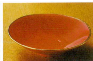
08014-737 四袖金赤平小鉢(有田焼) 1,950円 5×16入 (15×4.5cm)