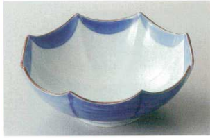
08003-147 濃淡濃笠型鉢 3,000円 60入 (15×5.5cm)