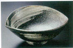
08001-667 刷毛目あみがさ小鉢(信楽焼) 3,500円 90入 (15×13×6cm)