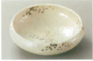
08004-517 洗入沓型丸向付 3,000円 40入 (15×4.8cm)