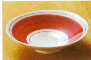
08010-737 絹十草(赤)平鉢(有田焼) 2,400円 5×16入 (15×4.5cm)