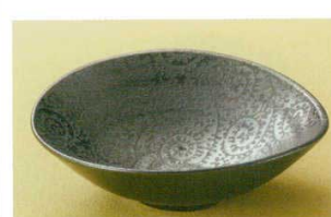
08017-467 銀彩唐草(黒)小判型浅小鉢(小) 1,350円 60入 (15×14×4.7cm)