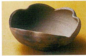
08006-667 炭化窯変割山椒向付(信楽焼) 2,860円 60入 (15×6.5cm)