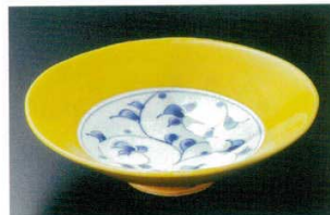
08009-737 掛け分け唐草(黄)平鉢(有田焼) 2,750円 5×16入 (15×4.5cm)