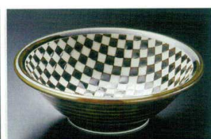
08020-057 雷地織部4.8寸深鉢 710円 80入 (15×5.7cm)