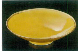
08011-737 四袖金黄平小鉢(有田焼) 1,950円 5×16入 (15×4.5cm)