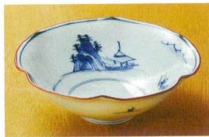
08005-737 洗琳山水 なぶり平小鉢(有田焼) 2,900円 5×16入 (15×5cm)