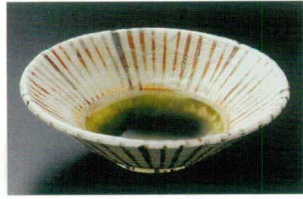
08007-517 志野織部十草50鉢 2,700円 40入 (15×4.5cm)