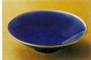
08012-737 四袖金青平小鉢(有田焼) 1,950円 5×16入 (15×4.5cm)