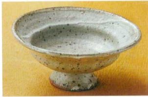
08002-667 灰みかけ高台鉢(信楽焼) 3,200円 70入 (15×6cm)