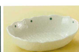
08022-557 織部ドット小判小鉢 550円 80入 (15×11.1×4cm)