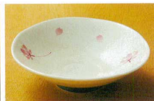
08015-737 桜の舞(赤)平鉢(有田焼) 1,700円 5×16入 (15×4.5cm)