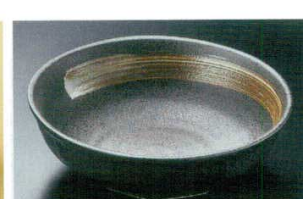
08023-467 黒斑点白刷毛石垣4.5ボール 480円 80入 (15×4.8cm)