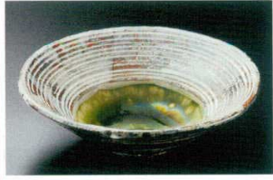
08008-517 鼠志野織部乙ま筋50鉢 2,700円 40入 (15×4.5cm)