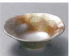
09930-457 白吹天目石垣小鉢 (美濃焼) 420円 100入 (12.2×4.1cm)