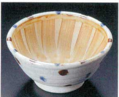
09922-557 水玉すり小鉢 (大) 650円 80入 (12×5.6cm)