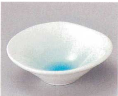
09920-457 ブルーたわみ鉢 (小) 650円 80入 (12×11×4.3cm)