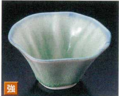
09917-557 御深井朝顔型小鉢 1,000円 80入 (12×11.7×6.4cm)