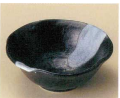
09924-577 白雲花小鉢 600円 60入 (12×5cm)