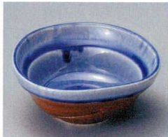
09911-247 ブルー三角4.0寸小鉢 1,300円 100入 (12×11×4.8cm)