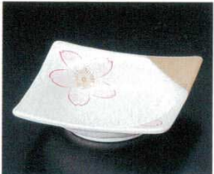
09918-407 粉引桜角鉢 780円 60入 (12×12×3cm)