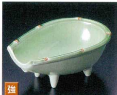
09912-557 緑彩箕型小鉢 1,300円 80入 (12×8.5×4.9cm)