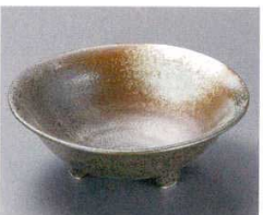
09927-457 白吹天目三ツ足小鉢 (美濃焼) 500円 120入 (12×4.2cm)