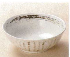
09929-407 刷毛粉引ゆらぎ4.0鉢 420円 100入 (12×4.5cm)