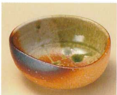
09914-667 古信楽三角小鉢 (信楽焼) 1,260円 100入 (12×12×5cm)