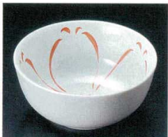
09913-737 花ひらり小鉢 (有田焼) 1,300円 5×19入 (12×5cm)