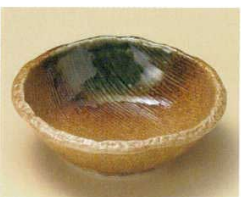
09925-457 伊賀織部クシ目香水 580円 80入 (12×3.8cm)