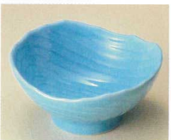
09923-577 トルコ木目小鉢 (中) 600円 80入 (12×11×5.9cm)