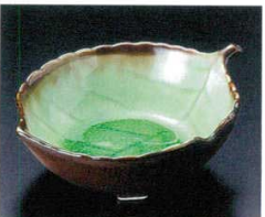
09926-237 南蛮木ノ葉型三ツ足小鉢 530円 140入 (12×9.5×4cm)