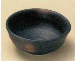
09916-307 備前風変形小鉢 1,050円 80入 (12×12.5×5cm)