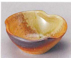
09915-667 古信楽4.0変形小鉢 (信楽焼) 1,160円 100入 (12×11.5×5.4cm)