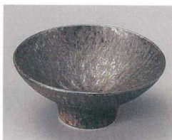
09910-467 金結晶とちり4寸高台鉢 1,350円 120入 (12×5.5cm)