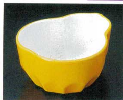
09905-177 黄釉見込みラスタ-ヒサゴ型小鉢 1,700円 60入 (12×10×5.4cm)