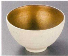
09901-667 焼 レ 金彩4.0丸小鉢 (信楽焼) 3,000円 (12×7cm)