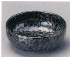
09908-187 銀彩亀甲3.8小鉢 1,350円 60入 (12×4.6cm)