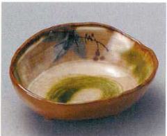
09919-547 織部どう三ツ足小鉢 750円 80入 (12×10.5×4.5cm)