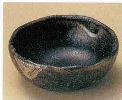
09904-667 黒窯変刷毛目小鉢 (信楽焼) 1,950円 90入 (12×5cm)