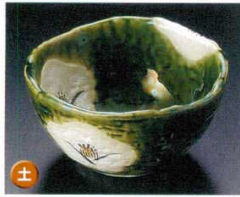
09906-517 織部椿深小鉢 1,650円 60入 (12×6.2cm)