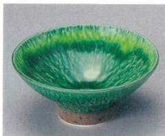
09909-467 緑釉黄流とちり4寸高台鉢 1,350円 120入 (12×5.5cm)