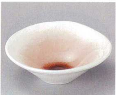
09921-457 パープルたわみ鉢 (小) 650円 80入 (12×11×4.3cm)