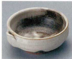
09903-667 灰釉粉引片口小鉢 (信楽焼) 2,750円 90入 (12×11×4.8cm)