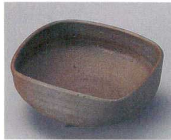
09902-667 黒焼締なて角中鉢 (信楽焼) 2,860円 90入 (12×13.5×5cm)