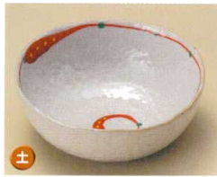
09907-517 粉引色絵4.0小鉢 (手描き) 1,400円 80入 (12×5cm)