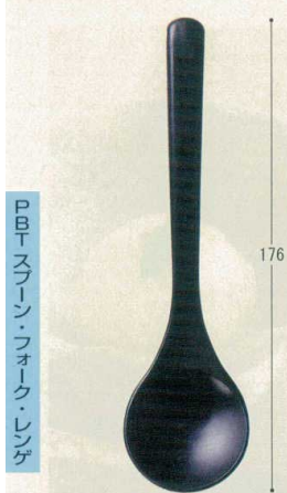
5-1189-7 ¥650 スプーン(大) 黒OM 176×43 3-1411-7 (82158181)