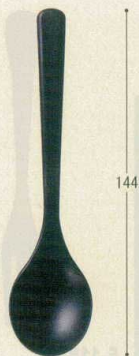
5-1189-1 ¥680 スプーン(小) 黒OM 144×38 3-1411-1 (82158179)