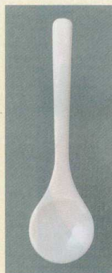
5-1189-2 ¥680 スプーン(小) 白OM 144×38 3-1411-2 (82158180)