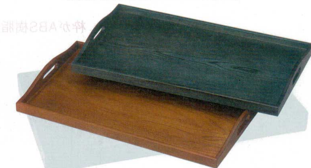
木製脇取盆 ウルミ乾漆 困 5-119-6 尺6 未天 ￥10,500 482×300×43 3-116-6 (15104740) 5-119-7 尺7 ￥11,000 515×303×43 3-116-7 (17280820) 5-119-8 尺8 ￥13,000 545×333×43 3-116-8 (17280830)