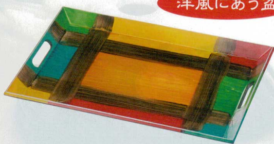
5-119-2 木製尺8脇取盆 ザルトツブルグ 困 545×360×40 3-116-2 (16914290)