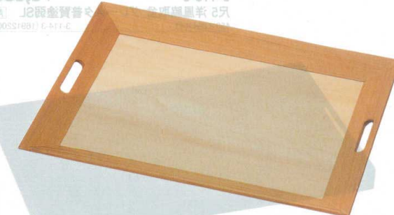
木製白木脇取盆 クリアー仕上げ 困 5-119-3 尺6 ￥15,900 475×370×30 3-116-4 (50302230) 5-119-4 尺2 ￥19,600 592×474×30 3-116-5 (50302240)