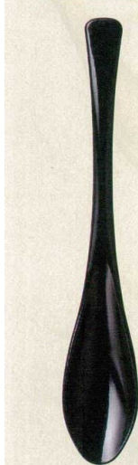
5-1192-7 ¥500 かゆスプーン(大) 黒OM 195×33 3-1414-7 (82158192)