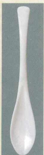
5-1192-8 ¥500 かゆスプーン(大) 白OM 195×33 3-1414-8 (82158193)