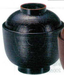
5-189-15 ¥650 千筋ケヤキ小吸椀 黒天朱 [A] 3-189-15 (32015580)