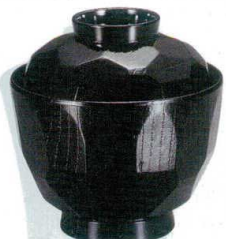
5-189-12 ¥600 3.0寸ミニ亀甲小吸椀 黒 [A] 3-189-12 (31001690)