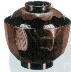
5-189-5 ¥520 ニュー亀甲小吸椀 新溜 [A] 3-189-5 (12034050)