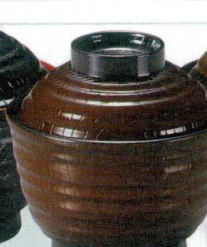
5-189-22 ¥850 3.5寸乱引木目小吸椀 溜 [A] 3-189-22 (33100140)