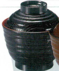
5-189-20 ¥750 3.5寸乱引木目小吸椀 黒内朱 [A] 3-189-20 (33100130)