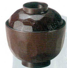
5-189-10 ¥600 亀甲小吸椀 溜 [A] 3-189-10 (35010020)