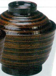
5-189-24 ¥1,000 3.5寸乱引木目小吸椀 枳 [A] 3-189-24 (12023250)