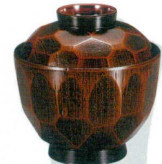
5-189-14 ¥950 3.0寸ミニ亀甲小吸椀 枳 [A] 3-189-14 (31001710)