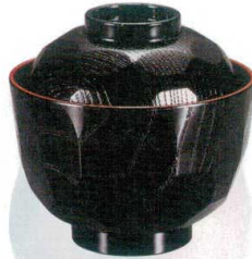
5-189-3 ¥510 ニュー亀甲小吸椀 黒内朱 [A] 3-189-3 (12034030)