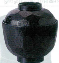
5-189-7 ¥500 亀甲小吸椀 黒 [A] 3-189-7 (35010025)