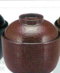
5-189-17 ¥700 千筋ケヤキ小吸椀 溜 [A] 3-189-17 (32015590)