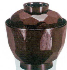
5-189-13 ¥650 3.0寸ミニ亀甲小吸椀 新溜 [A] 3-189-13 (31001700)