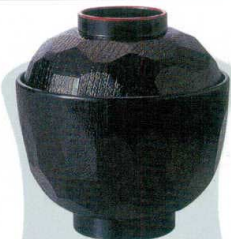
5-189-8 ¥550 亀甲小吸椀 黒天朱 [A] 3-189-8 (35010010)