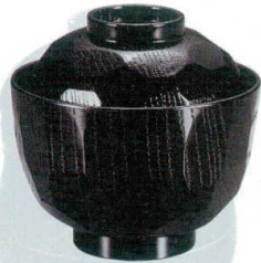
5-189-1 ¥500 ニュー亀甲小吸椀 黒 [A] 3-189-1 (12034010)