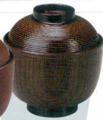
5-189-19 ¥900 千筋ケヤキ小吸椀 枳 [A] 3-189-19 (12023260)