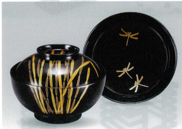
5-312-3 ¥113,000 木製煮物椀 黒漆塗/十草見返とんぼ 困 φ137×100 3-316-3 (31003050) 研出し 磨高時絵