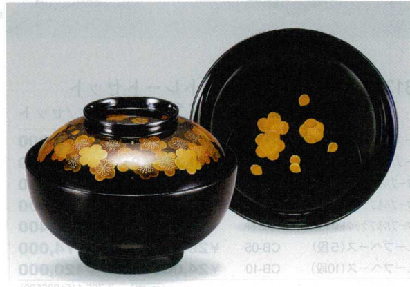
5-312-4 ¥141,000 木製煮物椀 黒漆塗/梅籠 困 φ137×100 3-316-4 (31003030) 研出し 磨時絵