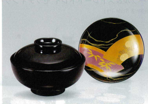
5-312-2 ¥85,000 木製4.5寸煮物椀 黒漆塗/見返し扇面 困 φ137×94 3-316-2 (31002880) 磨時絵