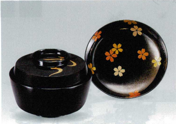
5-312-1 ¥84,000 木製4.5寸煮物椀 黒漆塗/雪月花 困 φ135×96 3-316-1 (31002960) 磨時絵