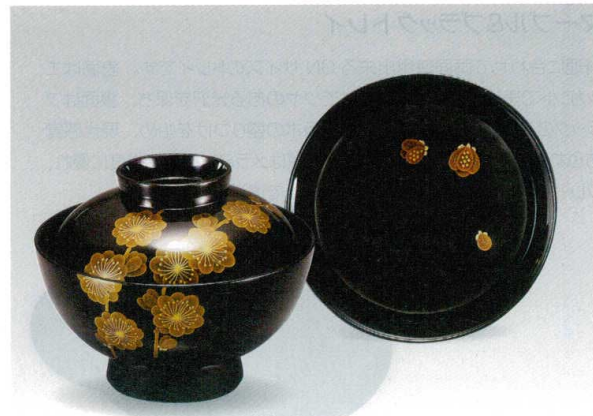
5-312-6 ¥123,000 木製4.5寸吸物椀 黒漆塗/研出し槍梅 困 φ130×103 3-316-6 (31002930) 研出し 磨時絵