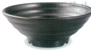
φ22.8長寿太ロクロ目麺鉢 M 5-349-6 黒マット ¥3,400 φ228×84(容量:1,300cc) 3-1237-6(51025680)