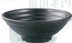
φ17.5長寿太ロクロ目麺鉢 M 5-349-4 黒マット ¥2,100 φ175×65(容量:650cc) 3-1237-4(51025660)