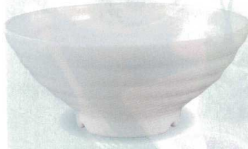
φ22.8福寿太ロクロ目麺鉢 M 5-349-3 白グロス ¥2,400 φ228×97(容量:1,600cc) 3-1237-3(51025710)