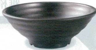
φ20.2長寿太ロクロ目麺鉢 M 5-349-5 黒マット ¥2,550 φ202×75(容量:1,000cc) 3-1237-5(51025670)