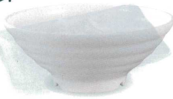
φ20.3福寿太ロクロ目麺鉢 M 5-349-2 白グロス ¥1,750 φ203×83(容量:1,100cc) 3-1237-2(51025700)