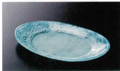
5-376-2 ¥4,400 290スカイ小判皿 (S-8707) [G] 290×190×25 3-808-2 (80519980)