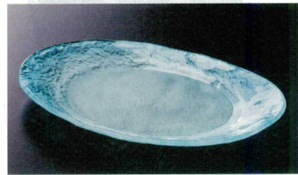
5-376-3 ¥5,600 340スカイ小判皿 (S-8708) [G] 340×220×30 3-808-3 (80519990)