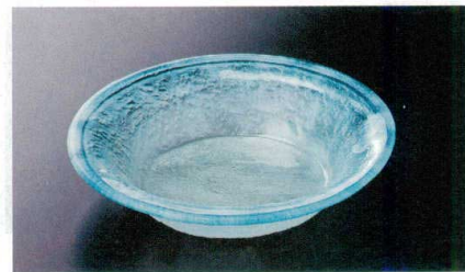
5-376-7 ¥5,200 φ270スカイ浅鉢 (S-8702) [G] φ270×55 3-808-7 (80519930)