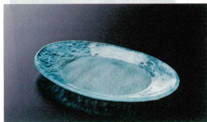
5-376-1 ¥2,900 240スカイ小判皿 (S-8706) [G] 240×150×20 3-808-1 (80519970)