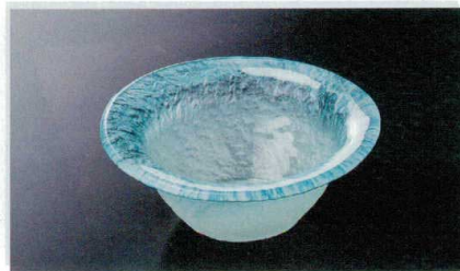
5-376-9 ¥4,500 φ225スカイ深鉢 (S-8699) [G] φ225×90 3-808-9 (80519900)