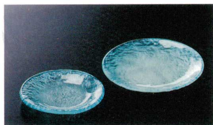
5-376-4 ¥1,400 5-376-5 ¥3,700 φ125スカイ丸皿 (S-8718) [G] φ225スカイ丸皿 (S-8717) [G] φ125×10 3-808-4 (80520100) φ225×15 3-808-5 (80520090)