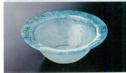
5-376-10 ¥6,500 φ290スカイ深鉢 (S-8700) [G] φ290×100 3-808-10 (80519910)