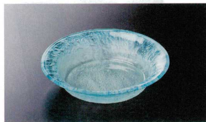
5-376-6 ¥4,400 φ240スカイ浅鉢 (S-8701) [G] φ240×50 3-808-6 (80519920)