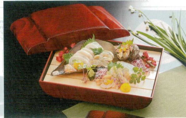
5-431-12 ¥2,150 9寸三階松 新雲内朱 (蓋) [A] 270×208×58 3-1010-7 (24023570)