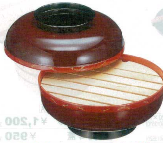
5-431-3 ¥14,700 尺0盛込椀 目皿付 溜松葉 [A] 困 φ304×207 3-1009-3 (51025020)