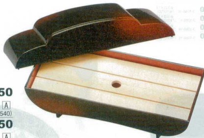
5-431-11 ¥3,200 長手三階松用 木製目皿 困 285×120×31 3-1010-3 (55008720)