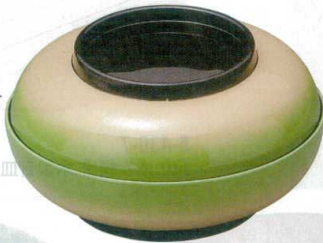
5-431-6 ¥9,800 尺0大名椀弁当 レゼルブグリーン [A] 仕切付 φ300×120 3-1009-10 (24233670)