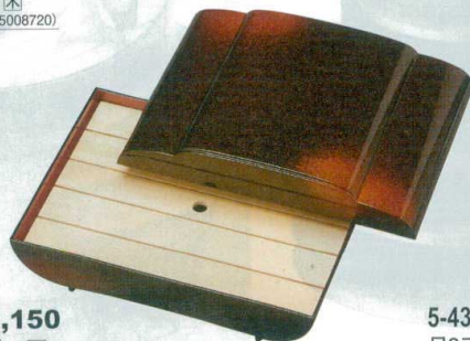
5-431-17 ¥5,650 尺2三階松用 木製目皿 困 342×247×35 3-1010-15 (55008740)