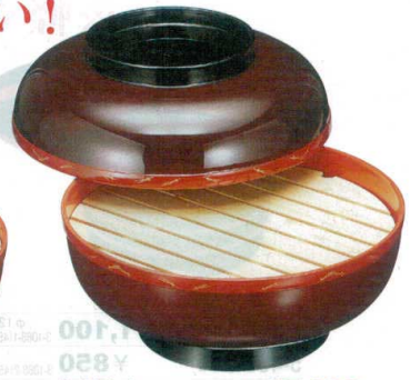
5-431-4 ¥17,900 尺2盛込椀 目皿付 溜松葉 [A] 困 φ364×251 3-1009-4 (51025010)