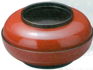
5-431-7 ¥7,100 8寸大名椀弁当 朱ツバ黒 [A] 仕切付 φ240×120 3-1009-11 (51272050)