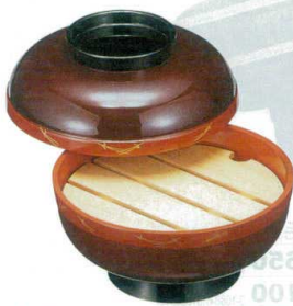
5-431-1 ¥6,700 6寸盛込椀 目皿付 溜松葉 [A] 困 φ181×139 3-1009-1 (51025040)