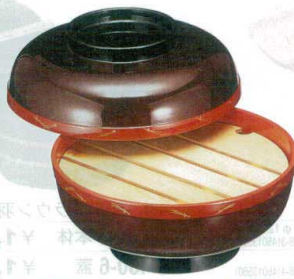
5-431-2 ¥9,500 8寸盛込椀 目皿付 溜松葉 [A] 困 φ242×173 3-1009-2 (51025030)