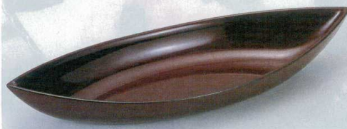
くま笹盛器 新溜 5-495-8 9寸 A ¥1,900 275×100×43 3-900-8 (55005760) 5-495-9 尺2 罎 ¥3,300 365×110×52 3-900-9 (55005950) 5-495-10 尺5 罎 ¥4,900 450×160×51 3-900-10 (55005770)