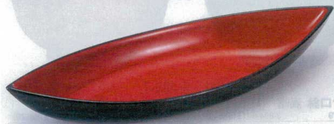
くま笹盛器 黒内朱 5-495-5 9寸 A ¥1,800 275×100×43 3-900-5 (55005785) 5-495-6 尺2 罎 ¥3,350 365×110×52 3-900-6 (55005960) 5-495-7 尺5 罎 ¥4,900 450×160×51 3-900-7 (55005790)