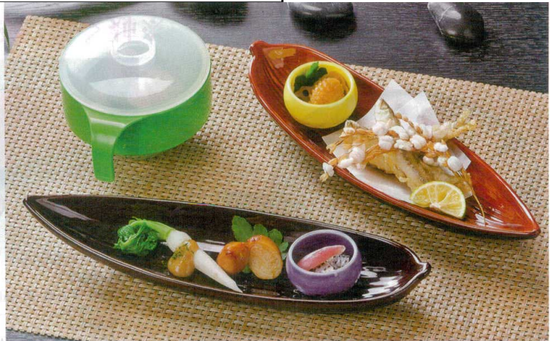
5-495-3 ¥2,900 9寸 笹型前菜皿 漆調溜 ITA 278×82×44 3-900-3 (51272174)