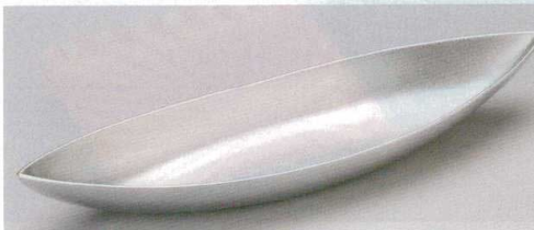
くま笹盛器 銀 5-495-11 9寸 A ¥3,900 275×100×43 3-900-11 (55005742) 5-495-12 尺2 罎 ¥5,800 365×110×52 3-900-12 (70009872) 5-495-13 尺5 罎 ¥9,000 450×160×51 3-900-13 (55005752)