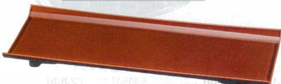
5-498-5 ¥4,900 (四本足タイプ) 尺2 長手春日盛器 漆調春慶 TA 360×137×32 (L型足付) 3-930-5 (51272135)