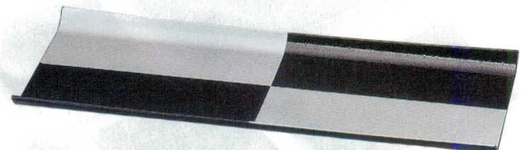
5-498-7 ¥5,100 (平底タイプ) 尺2 長手春日盛器 黒銀タタキ市松 TA 360×137×17 3-930-7 (51272134)