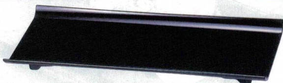
5-498-2 ¥3,650 (四本足タイプ) 尺2 長手春日盛器 漆調黒 TA 360×137×32 (L型足付) 3-930-2 (45015215)