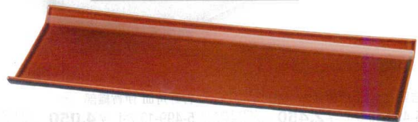
5-498-8 ¥3,950 (平底タイプ) 尺2 長手春日盛器 漆調春慶 TA 360×137×17 3-930-8 (51272136)