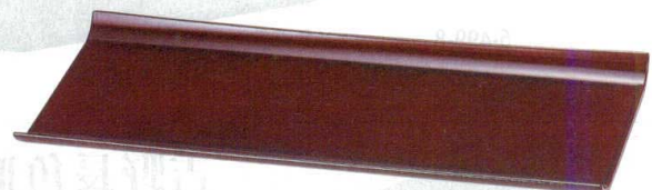
5-498-6 ¥3,300 (平底タイプ) 尺2 長手春日盛器 溜毘沙門天 TA 360×137×17 3-930-6 (45015060)