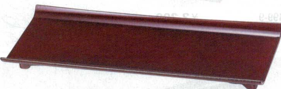
5-498-3 ¥4,350 (四本足タイプ) 尺2 長手春日盛器 溜毘沙門天 TA 360×137×32 (L型足付) 3-930-3 (45015065)