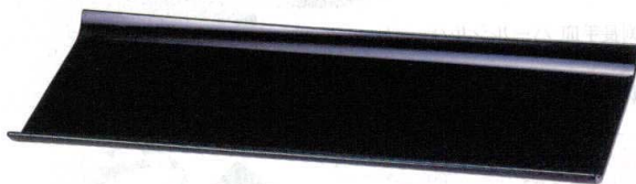
5-498-1 ¥2,600 (平底タイプ) 尺2 長手春日盛器 漆調黒 TA 360×137×17 3-930-1 (45015213)