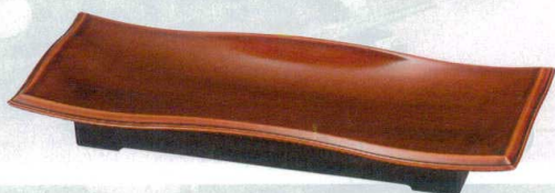
波瀾長手皿 漆調春慶 [A] 270×112×33 5-499-3 9寸 ¥2,950 3-890-3 (51272128) 356×146×41 5-499-4 尺2 ¥3,750 3-890-4 (51272129)