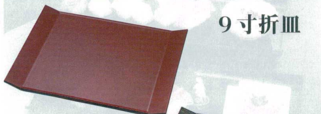
5-499-7 ¥1,600 9寸折皿 吟朱全面塗 [A] 272×213×17 3-929-1 (55007620)