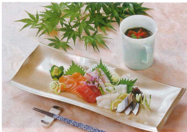
波瀾長手皿 パールシルバー [A] 270×112×33 5-499-5 9寸 ¥3,100 3-890-5 (51272130) 356×146×41 5-499-6 尺2 ¥3,900 3-890-6 (51272131)