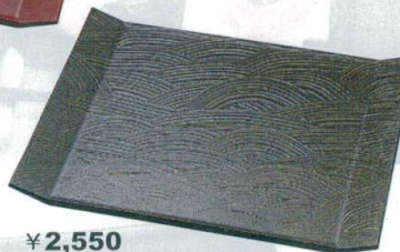
5-499-8 ¥2,550 9寸折皿 グリーン波全面塗 [A] 272×213×17 3-929-3 (55007640)