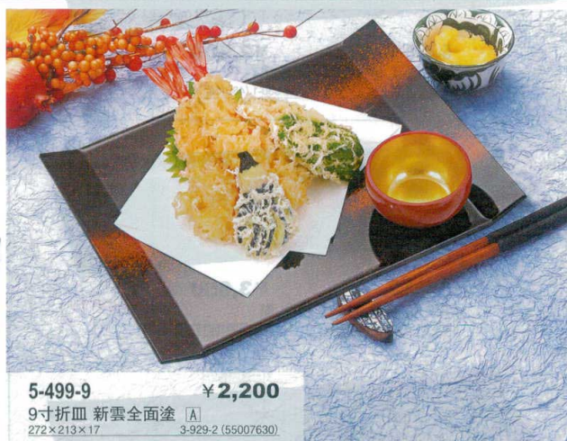
5-499-9 ¥2,200 9寸折皿 新雲全面塗 [A] 272×213×17 3-929-2 (55007630)