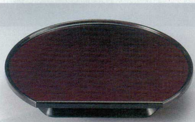
半月高台皿 溜 5-501-7 5.5寸 ¥1,800 165×137×36 3-905-3 (51304860) 5-501-8 6.0寸 ¥2,000 184×158×38 3-905-4 (51132716) 5-501-9 7.0寸 ¥2,200 202×177×38 3-905-5 (51304870) 5-501-10 8.0寸 ¥2,650 242×213×44 3-905-6 (51304880)