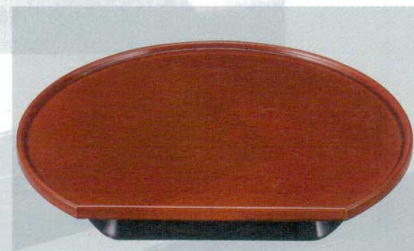
半月高台皿 漆調春慶 5-501-11 5.5寸 ¥2,600 165×137×36 3-905-7 (51272344) 5-501-12 6.0寸 ¥2,900 184×158×38 3-905-8 (51272345) 5-501-13 7.0寸 ¥3,000 202×177×38 3-905-9 (51272346) 5-501-14 8.0寸 ¥3,450 242×213×44 3-905-10 (51272347)