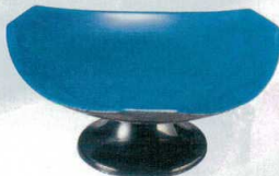
5-501-4 ¥1,700 シェリー皿 ブルー刷毛目 [A] φ157×67 (全面塗) 3-906-4 (51305030)