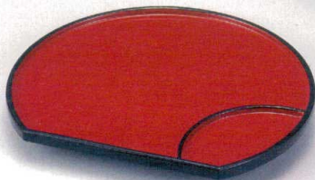
5-501-5 ¥1,850 7寸 タレ付半月高台皿 朱天黒 [A] 202×180×25 3-905-1 (55000100)