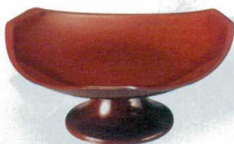
5-501-3 ¥1,500 シェリー皿 吟朱 [A] φ157×67 (全面塗) 3-906-3 (51305020)