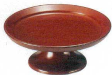
5-501-1 ¥1,300 ポート皿 吟朱 [A] φ139×55 (全面塗) 3-906-1 (51305040)