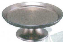
5-501-2 ¥2,200 ポート皿 銀すき [A] φ139×55 (全面塗) 3-906-2 (15157940)