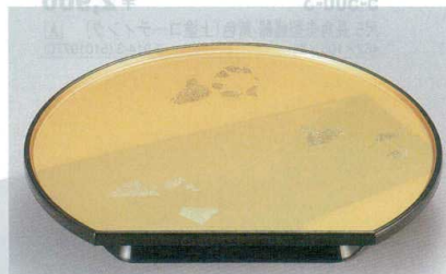
半月高台皿 金箔オトシ 5-501-15 5.5寸 ¥2,000 165×137×36 3-905-11 (51132740) 5-501-16 6.0寸 ¥2,200 184×158×38 3-905-12 (51132718) 5-501-17 7.0寸 ¥2,400 202×177×38 3-905-13 (51132750) 5-501-18 8.0寸 ¥2,900 242×213×44 3-905-14 (51132760)