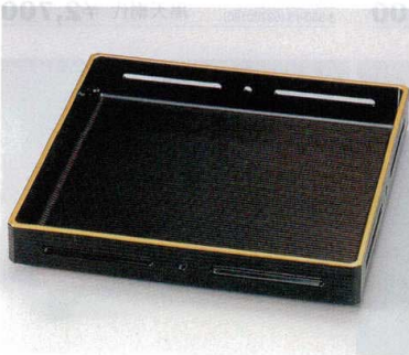
5-520-10 ¥2,200 8寸角すかし盛器 黒天金 [A] 238×238×38 3-853-5 (51011410)