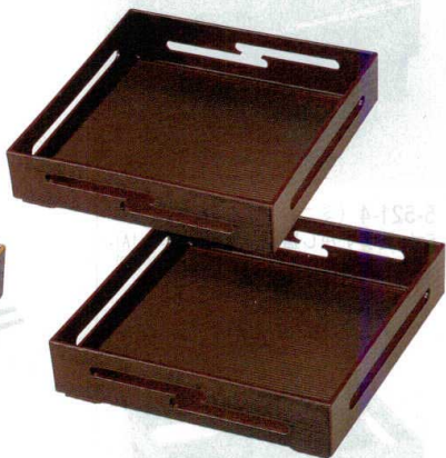
5-520-8 (小) ¥1,850 7寸角雲すかし箱 溜 [A] 213×213×56 3-853-2 (55000120)