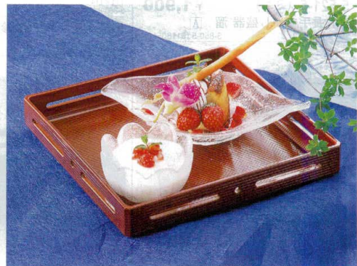
5-520-12 ¥2,500 8寸角すかし盛器 春慶塗 [A] 238×238×38 3-853-8 (51306210) (底板別)