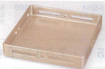
5-520-4 ¥3,000 6寸角すかし盛器 パールシルバー [A] 182×182×33 3-852-15 (51272306)