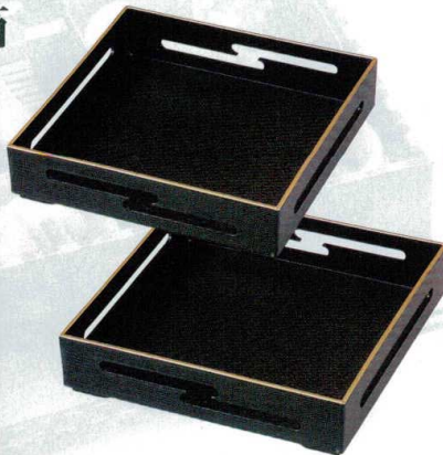
5-520-6 (小) ¥1,650 7寸角雲すかし箱 黒天金 [A] 213×213×56 3-853-1 (55000110)