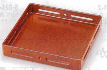
5-520-3 ¥1,900 6寸角すかし盛器 春慶塗 [A] 182×182×33 3-852-16 (51306200)