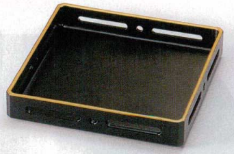
5-520-1 ¥1,600 6寸角すかし盛器 黒天金 [A] 182×182×33 3-852-10 (51011390)