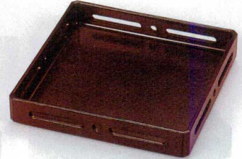
5-520-2 ¥1,500 6寸角すかし盛器 新溜 [A] 182×182×33 3-852-17 (51306201)