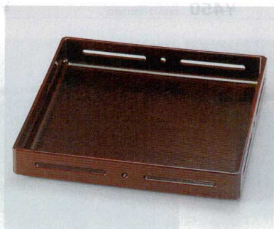
5-520-11 ¥2,500 8寸角すかし盛器 溜 [A] 238×238×38 3-853-9 (51180580)