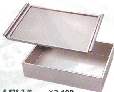
5-526-2 蓋 ¥2,400 22cmF蓋 銀透き [A] 220×148×15 3-858-11 (21011450)