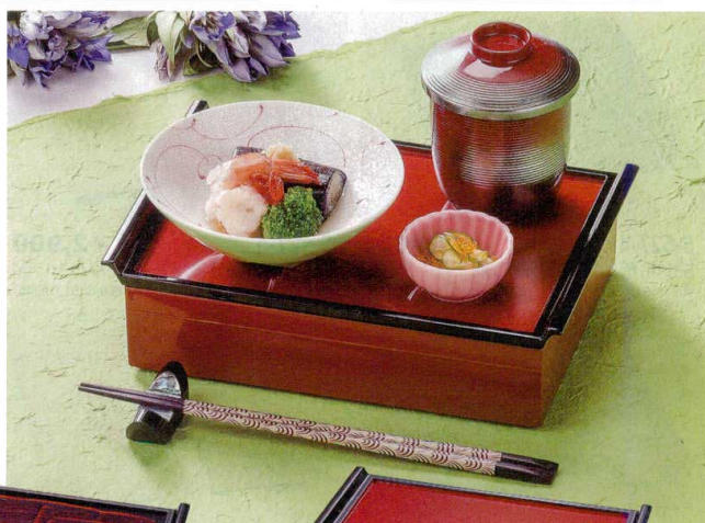
5-526-5 親 ¥2,050 6.5寸長角珍味箱 溜毘沙門天 [A] 200×148×50 3-858-8 (15820430)