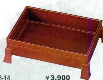
5-526-14 ¥3,900 6.5寸足付長角珍味箱(角型足) 漆調春慶 [A] 214×162×67 3-867-15 (51272254)