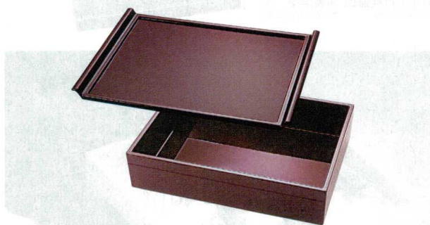
5-526-4 蓋 ¥1,650 22cmF蓋 溜毘沙門天 [A] 220×148×15 3-858-7 (21011460)