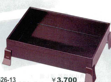
5-526-13 ¥3,700 6.5寸足付長角珍味箱(角型足) 漆調溜 [A] 214×162×67 3-867-14 (55001545)