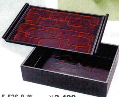
5-526-8 蓋 ¥2,400 22cmF蓋 漆刻塗 [A] 220×148×15 3-858-9 (21011440)