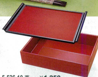
5-526-10 蓋 ¥1,250 22cmF蓋 朱天黒 [A] 220×148×15 3-858-3 (21011430)