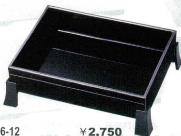
5-526-12 ¥2,750 6.5寸足付長角珍味箱(角型足) 黒天銀 [A] 214×162×67 3-867-13 (51140905)