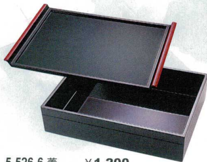
5-526-6 蓋 ¥1,200 22cmF蓋 黒天朱 [A] 220×148×15 3-858-5 (21011420)