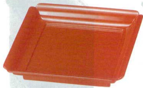
5-543-1 ¥1,500 6寸角彩り皿 柿朱 [A] 178×178×33 3-897-1 (51300670)