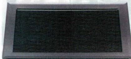
5-543-9 ¥1,950 尺0寸長手炉縁盆 銀彩内黒 [A] 302×217×12 3-1036-1 (55101010)