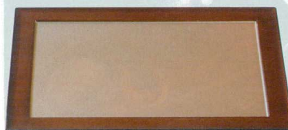
5-543-10 ¥2,800 尺0寸長手炉縁盆 銀透き瀧べっ甲 [A] 302×217×12 3-85-7 (55101030)