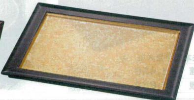
5-543-7 ¥2,650 8.5寸長角プレート 二色金箔 [A] 257×185×14 3-1032-4 (17411830)