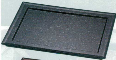
5-543-5 ¥1,650 8.5寸長角プレート 黒乾漆タタキ [A] 257×185×14 3-1032-1 (17411800)