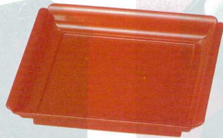
5-543-2 ¥1,800 7寸角彩り皿 柿朱 [A] 202×202×30 3-897-2 (51300330)