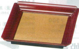
5-543-4 ¥2,900 7寸角彩り皿 溜内金パール [A] 202×202×30 3-897-4 (51272233)