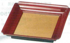
5-543-3 ¥2,700 6寸角彩り皿 溜内金パール [A] 178×178×33 3-897-3 (51272232)