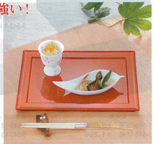
5-543-8 ¥1,500 8.5寸長角プレート 柿朱 [A] 257×185×14 3-1032-3 (17411790)