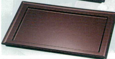
5-543-6 ¥2,000 8.5寸長角プレート 溜毘沙門天塗 [A] 257×185×14 3-1032-2 (17411810)