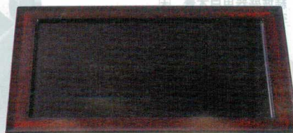
5-543-11 ¥2,700 尺0寸長手炉縁盆 漆刻内黒 [A] 302×217×12 3-85-6 (55101020)