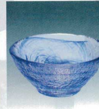
5-589-11 ￥650 陶器吹き上げみぞれ珍味鉢 藍流し G φ87×42 3-1077-11 (15159410)