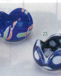
5-589-22 直運 ￥1,300 陶器京灰青磁吹墨珍味 (有田焼) 陶 φ42×30 3-1077-22 (93101540)