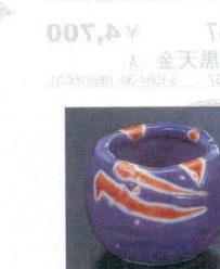
5-589-23 直運 ￥1,300 陶器京灰青磁染付丸珍味 (有田焼) 陶 φ42×30 3-1077-23 (93101550)