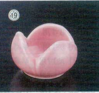
5-589-19 ￥1,000 陶器薄ピンク割山椒 (丸) 珍味 (有田焼) 陶 φ42×30 3-1077-19 (93101480)