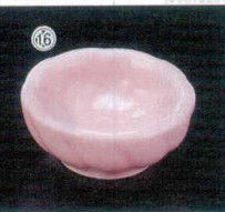
5-589-15 直運 ￥750 陶器ヒワネジリ梅ミニ珍味 (有田焼) 陶 φ52×24 3-1077-15 (93101610)