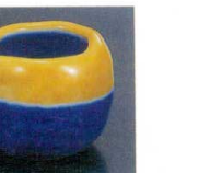
5-589-26 浏黄瑠璃釉 ￥1,150 陶器ツボ型珍味 (有田焼) (直運) 陶 φ33×30 3-1077-26 (93101570)