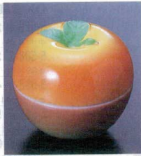
5-589-2 ￥700 陶器オレンジ珍味 陶 φ55×47 3-1077-2 (80500290)