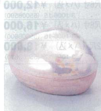
5-589-8 ￥750 陶器蓋付貝珍味 パール吹白化粧 陶 80×65×45 3-1077-8 (80500280)