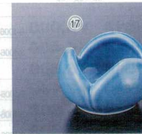
5-589-17 ￥1,000 陶器ライトブルー割山椒 (丸) 珍味 (有田焼) 陶 φ42×30 3-1077-17 (93101460)