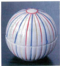
5-589-1 ￥800 陶器まり十草珍味 陶 φ65×6 3-1077-1 (80500300)