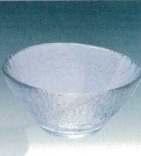
5-589-13 ￥650 陶器吹き上げみぞれ珍味鉢 水紋 G φ87×42 3-1077-13 (15159430)