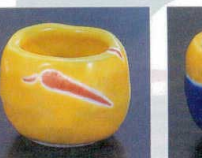
5-589-25 黄釉赤しぶき ￥1,150 陶器ツボ型珍味 (有田焼) (直運) 陶 φ33×30 3-1077-25 (93101580)