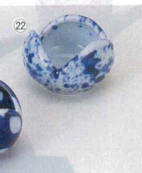
5-589-21 直運 ￥1,300 陶器コージ黒赤ヒワしぶき珍味 (有田焼) 陶 φ42×30 3-1077-21 (93101530)