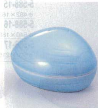
5-589-9 ￥750 陶器蓋付貝珍味 ブルー吹白化粧 陶 80×65×45 3-1077-9 (80500270)