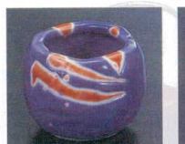
5-589-24 紫釉赤しぶき ￥1,150 陶器ツボ型珍味 (有田焼) (直運) 陶 φ33×30 3-1077-24 (93101560)