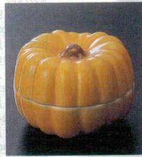
5-589-5 ￥650 陶器かぼちゃ珍味 陶 φ59×40 3-1077-5 (12015220)