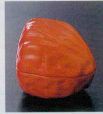
5-589-6 ￥650 陶器ほおつき珍味 陶 56×46×49 3-1077-6 (12015230)