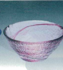
5-589-12 ￥750 陶器吹き上げみぞれ珍味鉢 紫流し G φ87×42 3-1077-12 (15159420)