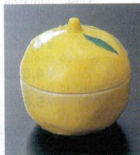
5-589-4 ￥650 陶器柚子珍味 陶 φ50×50 3-1077-4 (12015200)