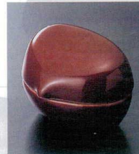
5-589-10 ￥650 陶器栗珍味 陶 56×45×40 3-1077-10 (12015210)