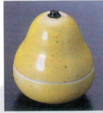
5-589-3 ￥700 陶器洋梨珍味 陶 φ57×64 3-1077-3 (80500280)