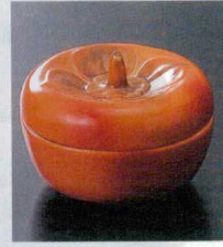
5-589-7 ￥650 陶器柿珍味 陶 φ62×43 3-1077-7 (12015240)