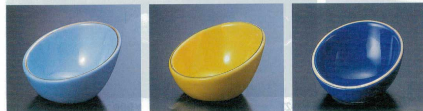
5-591-26 ￥750 陶器かまくら鉢 青磁 陶 72×70×46 3-1079-26 (80500120) 5-591-27 ￥750 陶器かまくら鉢 黄釉 陶 72×70×46 3-1079-27 (80500130) 5-591-28 ￥750 陶器かまくら鉢 瑠璃釉 陶 73×72×45 3-1079-28 (22651900)