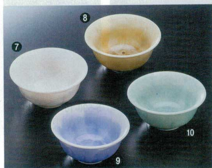
陶器結晶釉小杯 陶 5-591-7 白 ￥700 φ63×30 3-1079-7 (93017510) 5-591-8 黄 ￥700 φ63×30 3-1079-8 (93017520) 5-591-9 ルリ ￥700 φ63×30 3-1079-9 (93017530) 5-591-10 青磁 ￥700 φ63×30 3-1079-10 (93017500)