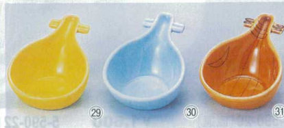
陶器琵琶珍味 陶 5-591-29 黄釉 ￥650 88×65×39 3-1079-29 (80500210) 5-591-30 青磁 ￥650 88×65×39 3-1079-30 (80500200) 5-591-31 茶 ￥650 88×65×39 3-1079-31 (80500220)