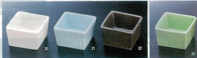
陶器5.8cm筋入角珍味 陶 5-591-20 白マット ￥600 60×60×H37 3-1079-20 (93017870) 5-591-21 青磁 ￥600 60×60×H37 3-1079-21 (93017880) 5-591-22 黒タタキ ￥600 60×60×H37 3-1079-22 (93017890) 5-591-23 黄緑 ￥600 60×60×H37 3-1079-23 (93017900) 5-591-24 黄 ￥600 60×60×H37 3-1079-24 (93017910) 5-591-25 ルリ ￥600 60×60×H37 3-1079-25 (93017920)