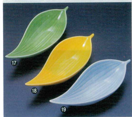
陶器笹鉢 (大) 陶 5-591-17 緑釉 ￥750 152×56×30 3-1079-17 (80500080) 5-591-18 黄釉 ￥750 152×56×30 3-1079-18 (80500090) 5-591-19 青磁 ￥750 152×56×30 3-1079-19 (80500070)