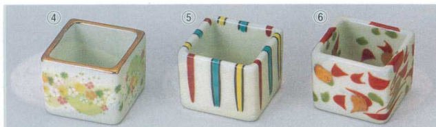
5-591-4 (直運) ￥1,700 陶器アイボリー吉の山マス型珍味 陶 43×43×34 (有田焼) 3-1079-4 (93101620) 5-591-6 (直運) ￥1,700 陶器万歴(C) 金付マス型珍味 陶 43×43×34 (有田焼) 3-1079-6 (93101640)