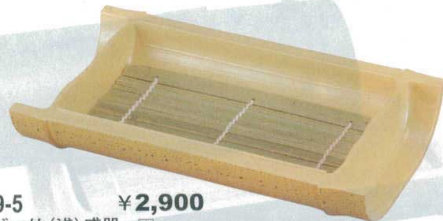
5-639-5 ¥2,900 越前ゴマ竹(浅)盛器 [A] 210×120×37 3-541-5 (54300075) (竹ス別)