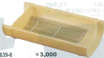
5-639-6 ¥3,000 越前ゴマ竹(深)盛器 [A] 210×120×47 3-541-6 (54300035) (竹ス別)