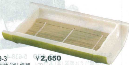
5-639-3 ¥2,650 越前若竹(浅)盛器 [A] 210×120×37 3-541-3 (54300060) (竹ス別)