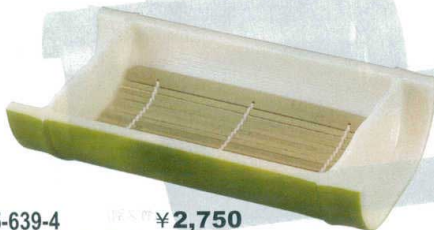
5-639-4 ¥2,750 越前若竹(深)盛器 [A] 210×120×47 3-541-4 (54300010) (竹ス別)