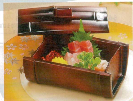
越前すす竹中鉢 [A][B] 5-639-14 蓋 ¥1,450 140×94×26 3-541-14 (55008160) 5-639-15 親 ¥2,600 140×94×53 3-541-15 (55008170) 5-639-16 竹ス ¥400 102×70 3-541-16 (45151806)