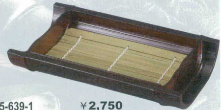
5-639-1 ¥2,750 越前すす竹(浅)盛器 [A] 210×120×37 3-541-1 (54300070) (竹ス別)