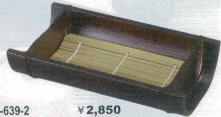
5-639-2 ¥2,850 越前すす竹(深)盛器 [A] 210×120×47 3-541-2 (54300070) (竹ス別)