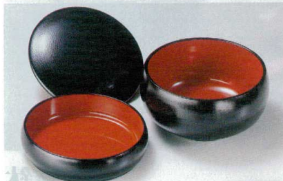
6寸 タイコ鉢 黒刷毛目 [A] 5-699-13 本体 ¥2,900 φ180×90 3-603-13 (38191230) 5-699-14 中子 ¥1,550 φ172×41 3-603-14 (38191231) 5-699-15 蓋 ¥1,400 φ180×25 3-603-15 (38191232)