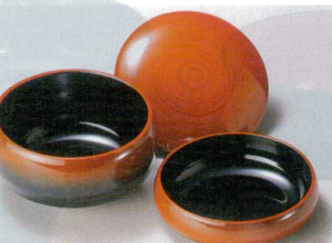
5寸 タイコ鉢 ルミナスオレンジ [A] 5-699-25 本体 ¥2,750 φ150×75 3-603-25 (38191351) 5-699-26 中子 ¥1,600 φ145×40 3-603-26 (38191352) 5-699-27 蓋 ¥1,700 φ145×23 3-603-27 (38191353)