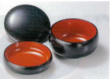
5寸 タイコ鉢 黒刷毛目 [A] 5-699-10 本体 ¥2,250 φ150×75 3-603-10 (38191220) 5-699-11 中子 ¥1,250 φ145×40 3-603-11 (38191221) 5-699-12 蓋 ¥1,250 φ145×23 3-603-12 (38191222)