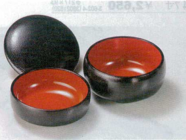
4寸 タイコ鉢 黒刷毛目 [A] 5-699-7 本体 ¥1,450 φ120×60 3-603-7 (38191210) 5-699-8 中子 ¥1,250 φ115×40 3-603-8 (38191211) 5-699-9 蓋 ¥950 φ118×21 3-603-9 (38191212)