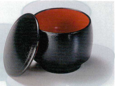
タイコ吸物椀 黒刷毛目 [A] 5-699-1 本体 ¥1,400 φ93×71 5-699-2 蓋 ¥800 3-603-1 (38191241) 3-603-2 (38191242)