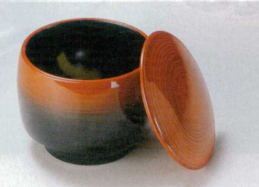
タイコ吸物椀 ルミナスオレンジ [A] 5-699-16 本体 ¥1,950 φ93×71 3-603-16 (38191331) 5-699-17 蓋 ¥1,100 φ93×16 3-603-17 (38191332)