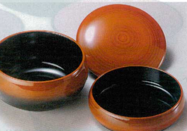
6寸 タイコ鉢 ルミナスオレンジ [A] 5-699-28 本体 ¥3,600 φ180×90 3-603-28 (38191341) 5-699-29 中子 ¥2,000 φ172×41 3-603-29 (38191342) 5-699-30 蓋 ¥1,950 φ180×25 3-603-30 (38191343)