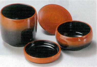
3.3寸 タイコそば椀 ルミナスオレンジ [A] 5-699-18 本体 ¥2,100 φ100×90 3-603-18 (38191321) 5-699-19 汁鉢 ¥1,700 φ97×50 3-603-19 (38191322) 5-699-20 薬味皿 ¥1,050 φ95×19 3-603-20 (38191323) 5-699-21 蓋 ¥1,100 φ98×14 3-603-21 (38191324)