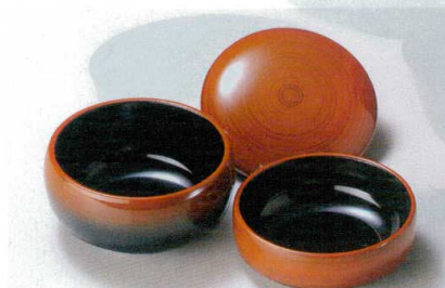
4寸 タイコ鉢 ルミナスオレンジ [A] 5-699-22 本体 ¥2,100 φ120×60 3-603-22 (38191361) 5-699-23 中子 ¥1,600 φ115×40 3-603-23 (38191362) 5-699-24 蓋 ¥1,350 φ118×21 3-603-24 (38191363)