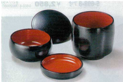
3.3寸 タイコそば椀 黒刷毛目 [A] 5-699-3 本体 ¥1,450 φ100×90 3-603-3 (38191251) 5-699-4 汁鉢 ¥1,150 φ97×50 3-603-4 (38191252) 5-699-5 薬味皿 ¥750 φ95×19 3-603-5 (38191253) 5-699-6 蓋 ¥800 φ98×14 3-603-6 (38191254)