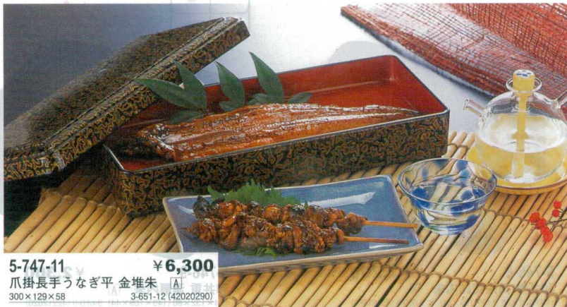
5-747-11 ¥6,300 爪掛長手うなぎ平 金堆朱 [A] 300×129×58 3-651-12 (42020290)