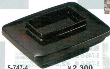
5-747-4 ¥2,300 和うなぎ平 曙 (内朱) [A] 166×130×65 3-651-5 (41210120)