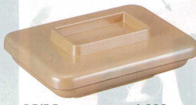
5-747-7 ¥4,800 新うなぎ平 銀内朱 [A] 189×141×59 3-651-8 (24025760)