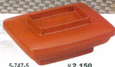
5-747-5 ¥2,150 和うなぎ平 柿朱 (内朱) [A] 166×130×65 3-651-6 (45151560)