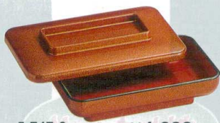
5-747-2 ¥1,000 御殿型ミニうなぎ平 梨地 [A] 138×86×44 3-651-3 (41010020)