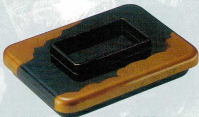
5-747-6 ¥2,650 新うなぎ平 新雲内朱 [A] 189×141×59 3-651-7 (41030310)