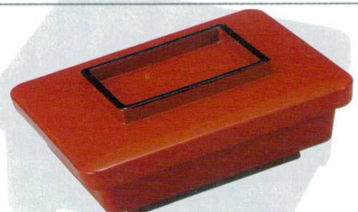
5-747-8 ¥2,200 うなぎ平 (大) 朱天黒内朱 [A] 185×155×70 3-651-9 (41030410)