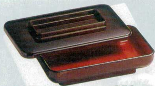
5-747-1 ¥950 御殿型ミニうなぎ平 溜 (内朱) [A] 138×86×44 3-651-1 (41010010)