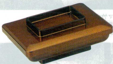
5-747-3 ¥1,800 福うなぎ平 梨地天黒内朱 [A] 163×127×65 3-651-2 (41060210)