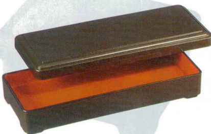
5-747-10 ¥2,800 爪掛長手うなぎ平/グリーンパール内朱 [A] 300×129×58 3-651-11 (45151882)