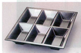
5-766-4 ¥1,300 8.5寸六ツ仕切 朱天黒 [A] 234×234×40 3-356-4 (23025550)