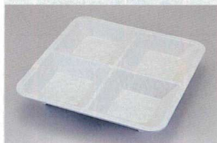
5-766-8 ¥2,050 8.5寸四ツ仕切 銀透き [A] 234×234×40 3-356-8 (55008850)