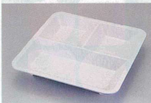
5-766-9 ¥2,150 8.5寸四ツ仕切 ホワイトアクア [A] 234×234×40 3-356-9 (55008840)