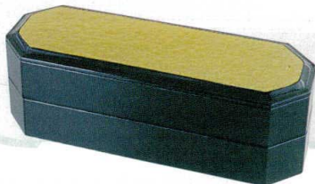
5-778-18 亀甲長手弁当 黄アクア内黒 [A] 363×128×15 3-366-18 (23000400) (蓋) ¥3,600