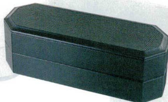
5-778-20 亀甲長手弁当 絞漆刻黒渦内黒 [A] 363×128×15 3-366-20 (23000420) (蓋) ¥2,200