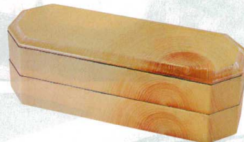
5-778-22 亀甲長手弁当 香林塗内黒 [A] 363×128×15 3-366-22 (23000440) (蓋) ¥2,550