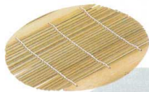
5-837-1 ¥950 ひさご弁当用竹ス 附 175×146 3-425-5 (49930060)