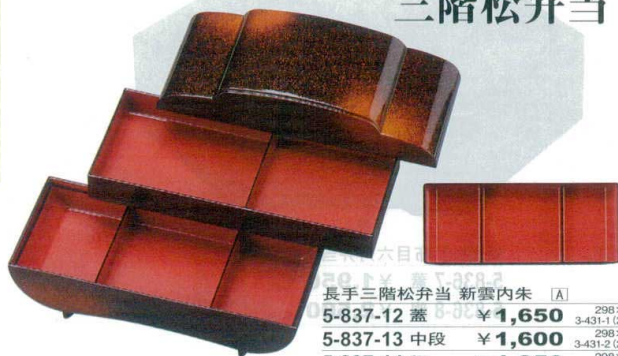
長手三階松弁当 新雲内朱 [A] 5-837-12 蓋 ¥1,650 298×129×60 3-431-1 (24023540) 5-837-13 中段 ¥1,600 298×129×38 3-431-2 (24023550) 5-837-14 親 ¥1,850 298×129×67 3-431-3 (24023560) 5-837-15 仕切 朱 ¥1,150 3-431-4 (24020214)