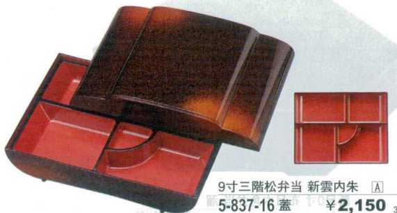
9寸三階松弁当 新雲内朱 [A] 5-837-16 蓋 ¥2,150 268×208×58 3-431-5 (24023570) 5-837-17 親 ¥2,500 268×208×62 3-431-6 (24023580) 5-837-18 仕切 朱天黒 ¥1,400 3-431-7 (24020115)