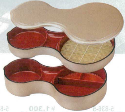
ひさご弁当 新雲 [A] 竹ス別 5-837-3 蓋 ¥1,800 315×190×11 3-425-1 (24023720) 5-837-4 浅親 ¥2,250 315×190×30 3-425-2 (24023730) 5-837-5 深親 ¥2,350 315×190×55 3-425-3 (24023740)