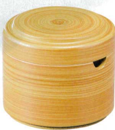
5-942-4 ¥1,550 つつ型粉茶入れ 白木 [M] φ70×60 3-708-4 (13000221)