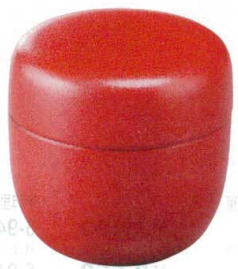
5-942-6 ¥1,200 6cmナツメ型粉茶入れ 朱乾漆 [M] φ60×61 3-708-6 (13000223)