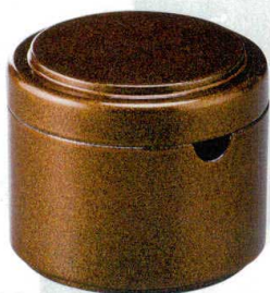
5-942-1 ¥1,300 つつ型粉茶入れ 梨地 [M] φ70×60 3-708-1 (13000220)