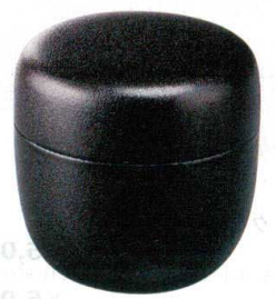
5-942-5 ¥1,200 6cmナツメ型粉茶入れ 黒乾漆 [M] φ60×61 3-708-5 (13000222)