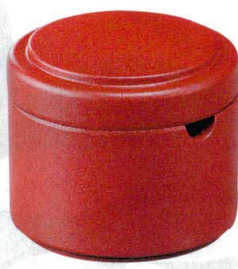
5-942-2 ¥1,450 つつ型粉茶入れ 朱乾漆 [M] φ70×60 3-708-2 (13000219)