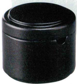
5-942-3 ¥1,500 つつ型粉茶入れ 黒乾漆 [M] φ70×60 3-708-3 (13000218)