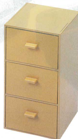
5-942-8 ¥7,500 縦型ティーパック入れ クリーム乾漆 [A] 98×99×182 3-708-8 (12017010)