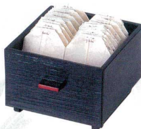
5-942-7 ¥1,600 足付ティーパック入れ 黒 90×95×65 3-708-7 (12026800)