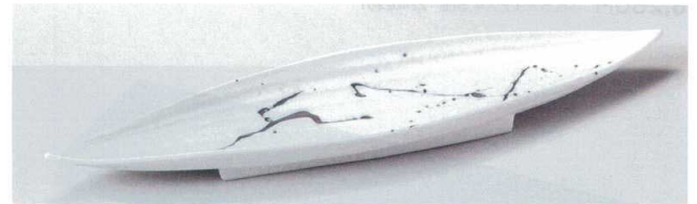
136-4-755 白結晶黒とばし笹型長皿 2,700円 41×10.2×3cm 13604755