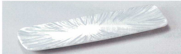
136-7-555 白さざれ彫長皿 1,680円 35.2×11×2cm 13607555