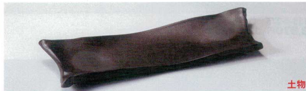
136-5-525 炭化土ちぎり長皿 2,350円 35×13×3.5cm 19710521