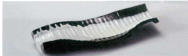
136-3-555 カイラギうねり串目尺皿 3,300円 34×13.5×5cm 15入 21504552