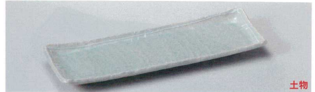
136-2-725 京貫入12.0長角皿 3,780円 37×12.7×3.2cm 19803721