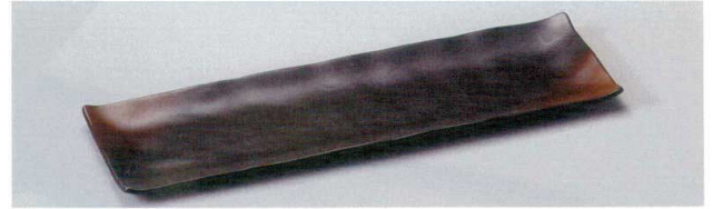
136-12-215 南蛮長皿 1,050円 34.5×11×1.8cm 20013211