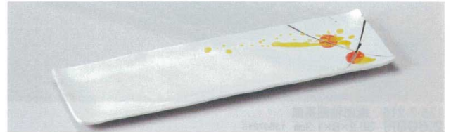
136-10-265 あけぼの赤釉さんま皿(大) 1,480円 34.5×11×1.8cm 40入 13610265