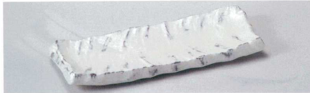
136-1-555 粉引拭取りガタ彫12.0皿 4,850円 37×14.5×4cm 15入 21403552