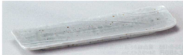
136-9-525 湖畔荒瀬型長皿 1,580円 36×9.5×2.8cm 22404532