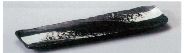
136-6-375 黒炭白刷毛細長皿(美濃焼) 1,800円 35.5×9.8×2.5cm 13309373