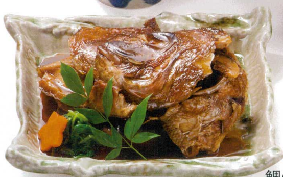
鯛の兜煮 角皿 Kabutoni (boiled head) of sea bream Square Plate 白あえ 小鉢 Tofu salad Square plate (small)

カジュアルな雰囲気であげに楽しめる。しかも揚物や刺身はもちろん煮物や焼物鍋料理など多くの献立がーカ所で味わえる場所として居酒屋が注目を集めています。焼鳥を中心としたお店や、串カツなどの揚物をメインとするお店、海鮮を主体としたお店など様々なお店が個性を競い合っています。料理はもちろんお酒にもこだわりを持つお店では日本酒や焼酎の他、洋酒や各種カクテル等も楽しめます。