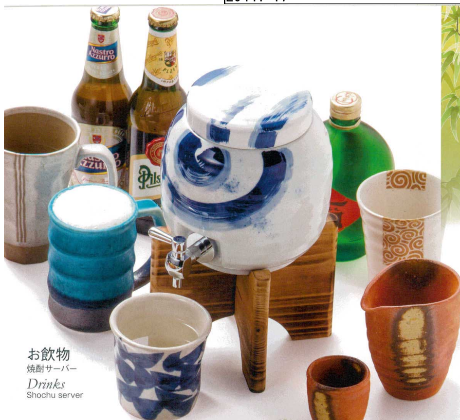
お飲物 焼酎サーバー Drinks Shochu server