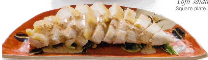
蒸し鶏ピーナツソース 突出皿 Steamed chicken with peanut sauce Long Plate

Izakayas are now extremely popular for the casual atmosphere and the wide range of menus, such as sashimi, fried/cooked foods, and nabe. Thousands of Izakaya shows their own specialties, such as Yakitori, Kushikatsu, and Seafoods. At Izakaya, not only particular about foods but also liquor, in addition to Japanese sake and shochu, western liquors and cocktails can be enjoyed.