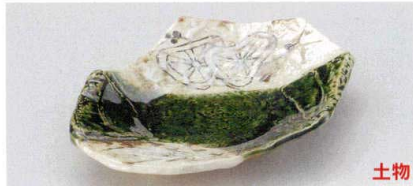
243-4-555 御所車変形7.0皿 2,750円 21.2×16.2×3.6cm 40入 17901552