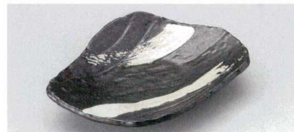
243-15-375 黒炭白刷毛焼き皿(美濃焼) 1,200円 21×17×3.5cm 25901373