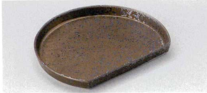
243-1-525 金結晶半月前菜皿 2,800円 19.5×16.2×2cm 24301525