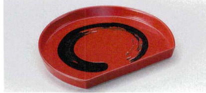
243-2-525 ゆず赤黒刷毛半月前菜皿 2,800円 19.5×16.2×2cm 24302525