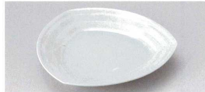
243-12-365 うすあさぎ前菜皿 1,900円 21×3cm 24312365