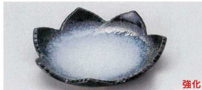
243-10-715 雲海葉型6.0皿 2,050円 18.2×18.2×3.2cm 55413781