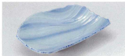
243-13-555 青地流水彫焼物皿 1,880円 22×16.4×3cm 21108551