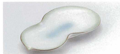
243-18-715 若草ひさご突出皿 920円 21×12.5×2.5cm 52615711