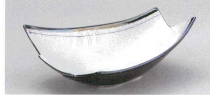
243-3-755 ラスター二色一珍変形皿 2,800円 14×6cm 24303755