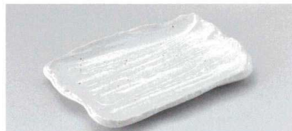
243-14-375 白釉荒ソギ焼物皿 1,200円 22×15×2cm 25305372