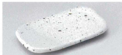
243-17-525 石庭22cm長角皿(白) 1,100円 22.1×13.3×2.1cm 20519524