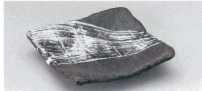
243-5-555 炭化土正角白刷毛7寸皿 2,590円 19×18.5×3.8cm 30入 18818551