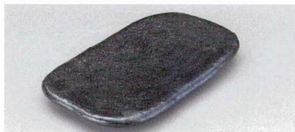
243-16-525 石庭22cm長角皿(黒) 1,100円 22.1×13.3×2.1cm 20518524