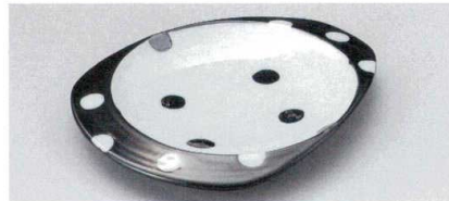
243-11-215 ドット変形皿 1,900円 22.3×18×2.5cm 18909213