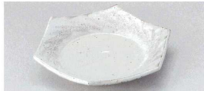
243-8-635 粉引櫛目六角皿 2,150円 19.5×17×3.6cm 19013631