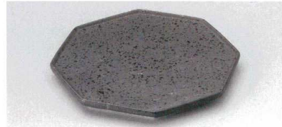
243-6-215 いぶし黒八角皿 2,400円 22.3×21×1.9cm 20306214