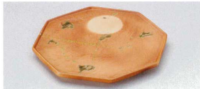
243-7-525 焼バ満月八角前菜皿 2,200円 22.2×20.7×1.8cm 20305524