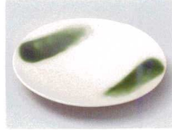
257-15-725 織部刷毛5.0丸皿 830円 16.3×2cm 25229721