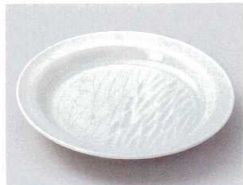
257-6-215 青白磁波紋5.5皿 1,350円 16.8×2.5cm 25202211