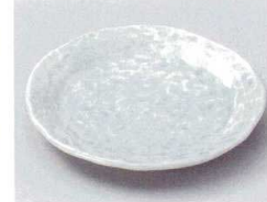
257-17-375 みちのく荒石目丸皿 810円 17×2.5cm 27707372