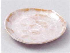
257-14-355 赤志野5.5皿 870円 17×16.7×2.2cm 25219351