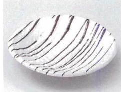
257-10-215 残雪三ツ足5.0皿 1,200円 16.4×2.8cm 23306214