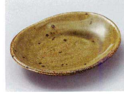
257-25-715 黄唐津5.0小判皿 650円 16.5×13×2.9cm 25325711