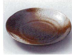
257-28-155 備前風白吹5.0皿 470円 16.5×2.8cm 27721153