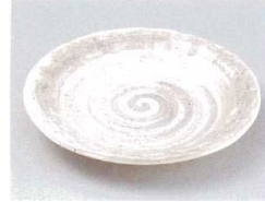
257-26-505 東風石目5.0皿 500円 16.5×2.2cm 25530501