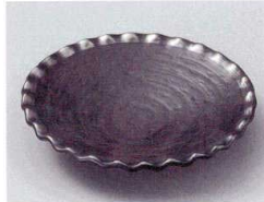
257-8-525 黒マットプラチナ彩波型フルーツ皿 1,350円 16.5×3.3cm 27425523