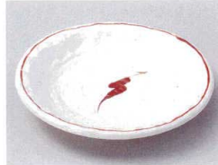
257-13-675 唐辛子5.0皿 920円 16.5×2cm 25508671