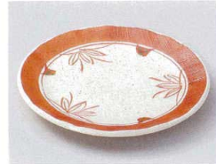
257-21-215 布目赤絵花フルーツ皿 750円 16.3×1.5cm 25232211