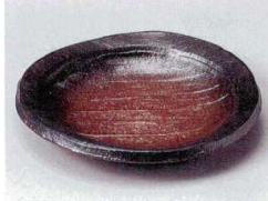
257-3-285 黒吹ケズリ皿 2,100円 16.8×2.8cm 50入 03104281