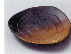
257-27-055 黒備前吹三角5.0皿 480円 16.3×2.8cm 25313051