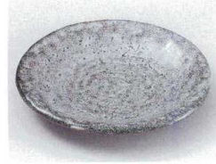
257-20-205 雲石5.0皿 800円 16.5×2.3cm 55142201