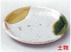
257-4-715 三彩芦5.5丸皿 1,840円 17.2×1.8cm 25108711