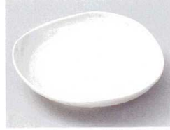
257-29-035 ハケメ粉引三角5.0皿 380円 16.5×3.2cm 23924034 257-30-035 ハケメ粉引三角4.0皿 320円 13.6×2.8cm 24527034