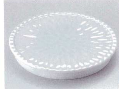
257-2-215 青白磁波条紋丸皿 2,150円 17×2cm 25702215