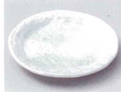
257-18-675 白荒石目17cm丸皿 800円 17×2cm 27708672