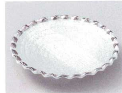
257-7-525 白結晶プラチナ彩波型フルーツ皿 1,350円 16.5×3.3cm 27422523