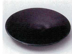
257-16-725 黒袖丸5.0皿 830円 16.3×2cm 25230721