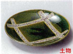
257-1-035 オリベ井桁唐草和皿 2,500円 17×2.5cm 23006034