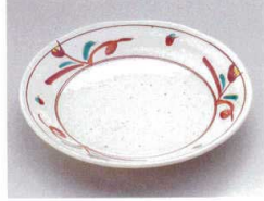
257-24-275 赤絵花5.0皿 700円 16.5×2.8cm 25724275