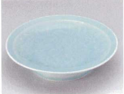
257-9-185 青白磁唐草高浜5.0皿 1,320円 16.3×4cm 25709185