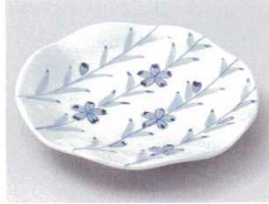
257-19-715 花だより5.5丸皿 800円 17×2.6cm 16507711