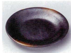
257-11-755 焼締め5.5寸丸皿(ハマ付) 1,150円 16.9×2cm 57018753