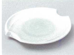
257-5-185 青白磁変形楕円皿(小) 1,620円 17×15.8×2.2cm 25112181