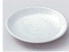
257-23-675 白砂目5.0皿 720円 16.3×2.5cm 28028672