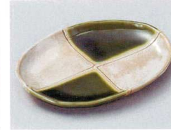
257-22-715 オリベ市松小判取皿 730円 16.7×12.3×1.6cm 25227711