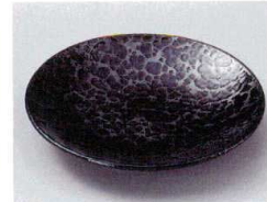
257-12-355 黒銀彩5.5皿 1,020円 16.8×2.6cm 27815352