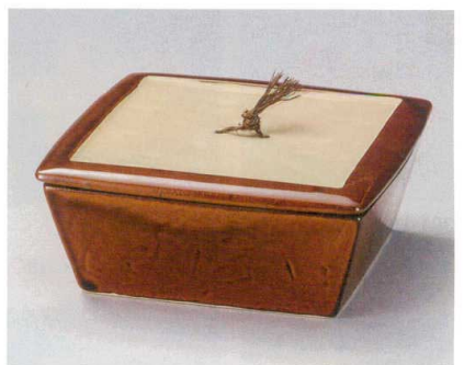
302-7-715 椿陶箱(大) 5,000円 15.5×15.5×7cm 29810714