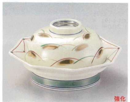
302-4-715 間取紅葉7.0骨むし 6,500円 22×11.5cm 30205711