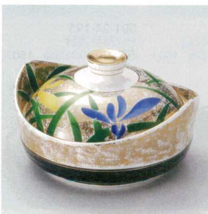
302-9-715 アメ軸正角蓋向 2,560円 13.5×13.5×5.5cm 30422711