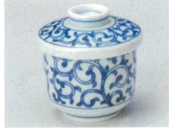
313-23-205 青唐草むし碗 550円 8.4×9.3cm (230cc) 31922201