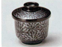
313-3-505 天目唐草むし碗 780円 9.2×9.7cm (250cc) 32130503