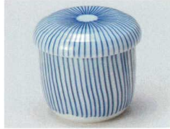
313-4-515 十草むし碗 730円 7.6×8cm (220cc) 32236512