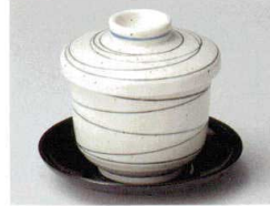
313-28-525 梨地ラインむし碗 560円 8.1×9.4cm (230cc) 31932521