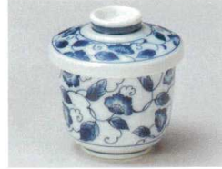
313-29-715 葉唐草むし碗 490円 8.4×9.7cm (230cc) 31935711