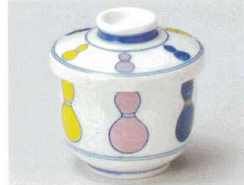
313-20-675 ひざごむし(蓋付) 580円 8×9cm (230cc) 10入 31915671 313-21-675 ひざごむし(身) 320円 31916671