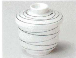
313-13-265 粉引ラインむし碗 620円 8×9cm (230cc) 60入 30819264