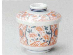
313-14-265 万暦むし碗 620円 8×9cm (230cc) 60入 31314265