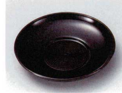
313-32-525 黒ケヤキ木目むし受皿(ABS) 420円 10.4×1.7cm 32332523