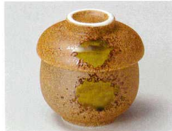
313-6-265 伊賀織部吹きむし碗 720円 7.3×8.5cm (210cc) 60入 30807264