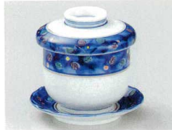
313-2-715 帯木の葉むし碗 840円 8.2×9.1cm (250cc) 31726711