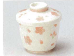
313-19-375 さくらざくら蒸し碗(美濃焼) 580円 9.4×9.5cm (230cc) 32235373