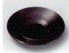
313-33-525 うるみケヤキ木目むし受皿(ABS) 360円 10.4×1.7cm 32315523