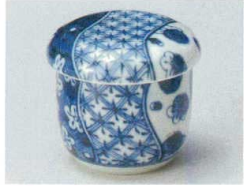
313-5-515 祥瑞むし碗 730円 7.6×8cm (220cc) 32238512