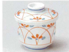
313-17-675 赤小花むし(蓋付) 580円 8×9cm (230cc) 10入 31913671 313-18-675 赤小花むし(身) 320円 31914671