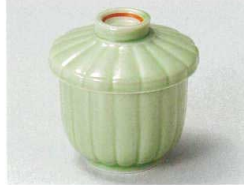
313-9-735 ヒワ菊型小むし碗 710円 7.2×8.4cm (170cc) 31318734