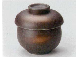
313-7-265 黒備前吹むし碗 720円 7.5×9cm (210cc) 60入 31307265