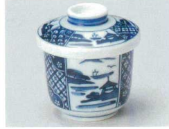
313-30-715 間取山水むし碗 490円 8.4×9.7cm (230cc) 30838714