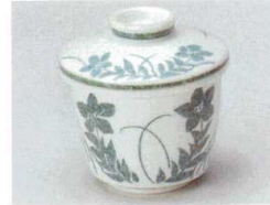
313-26-675 グリン桔梗むし(蓋付) 540円 8×9cm (220cc) 10入 31923671 313-27-675 グリン桔梗むし(身) 300円 31924671