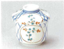
313-1-725 アイボリー萩小むし碗 930円 7.5×8.6cm (160cc) 31607721