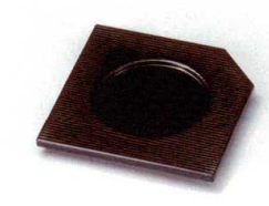
313-31-525 うるみ隅切筋むし受皿(ABS) 600円 10×10cm 32311523