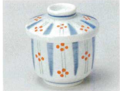
313-15-675 梅十草むし(蓋付) 580円 8×9cm (230cc) 10入 31911671 313-16-675 梅十草むし(身) 320円 31912671