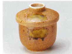
313-12-255 伊賀風ミニむし碗 640円 7×8.5cm (190cc) 31917251