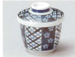
313-24-675 梅祥瑞むし(蓋付) 540円 8×9cm (220cc) 10入 31920671 313-25-675 梅祥瑞むし(身) 300円 31921671