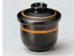
313-22-675 黒茶オビ小むし碗 560円 7×8.7cm (170cc) 32941672