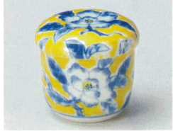
313-10-375 黄彩花紋蒸し碗(美濃焼) 700円 8.5×8cm (200cc) 32030373