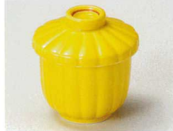
313-8-735 黄菊型小むし碗 710円 7.2×8.6cm (170cc) 31317734