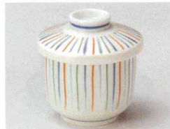
313-11-505 色十草むし碗 700円 9.2×9.7cm (250cc) 32226503