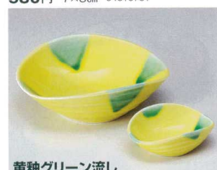
黄釉グリーン流し

53-15-285 5.5向付 2,200円 17×16×3.2cm 60入 05315285 53-16-285 豆皿 1,150円 8×2cm 160入 05316285