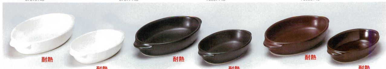
673-20-115 白楕円グラタン大 1,750円 23.5×13.2×4.1cm 67812114