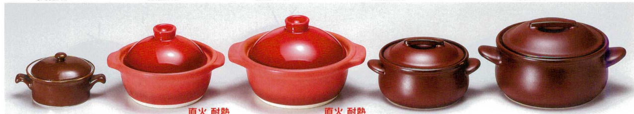
673-11-185 茶3時キャセロール 1,180円 12.5×9.2×6.4cm 67311185