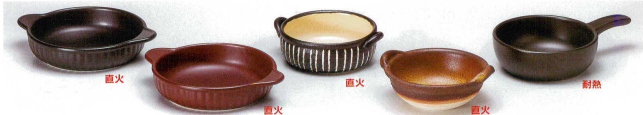
673-1-525 黒丸グラタン 1,400円 21.4×17×4cm 69911521