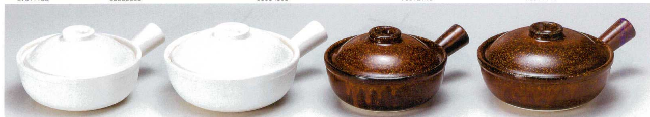
673-16-145 白釉片手鍋小 3,500円 22.6×16.5×6.3cm 67316145