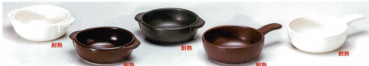
673-6-115 白丸グラタン大 1,500円 18×14.5×5.3cm 67503114